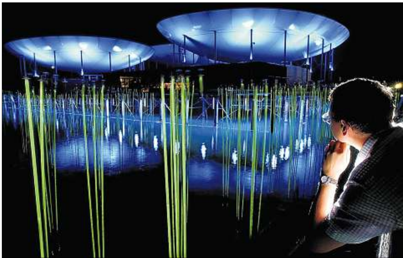
Natira ed artificialità – il tema da l'arteplage a Neuchâtel.

Ils edifizis dal parc d'expoziuns èn situads da mintga vart da la vasta promenada. A la fin da questa via da flunar en direziun dal lai s'avra ina vista panoramica spectaculara sin il forum imposant che sumeglia in portaviun. Là pon ils visitaders chaminar – forsa cun in pass in pau pli lev – sur la puntetta dals peduns (450 meters lunga) che traversa la riva dal lai e collia il parc da l'Expo cun il forum, damai la libertad cun la pussanza. Enturn las trais turs sa storgiglia il «Skywalk», ina gronda rampa ch'envida ad