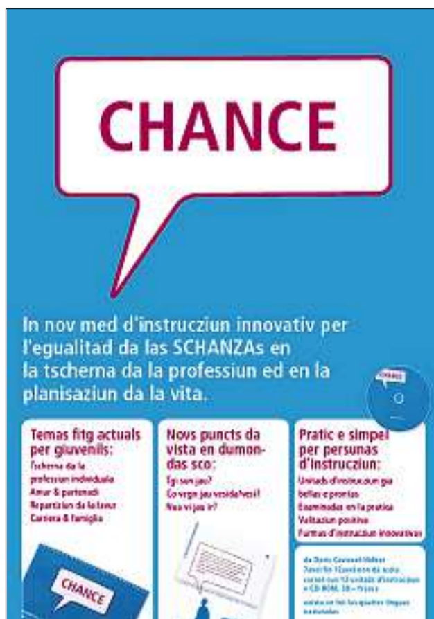
Cuverta e survista dal cuntegn dal med.