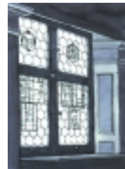
leaded windows Butzenscheiben fenêtres à petits carreaux finestre al piombo fanestras da rudellas