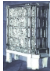
Kachelofen fourneau de faïence stufa in maiolica pigna da maiolica