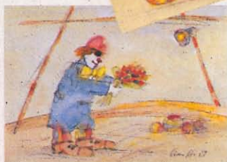
B P. Stauffenegger