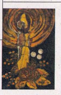
N K. Furrer