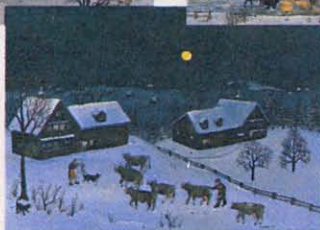
A H. Gdel