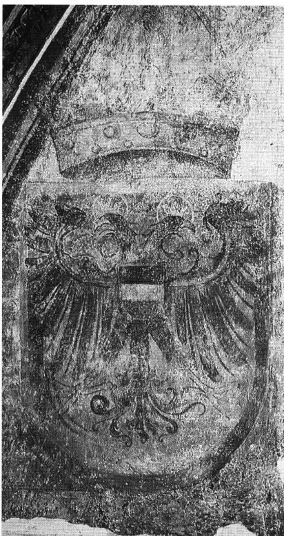
4: Doppeladlerwappen Kaiser Friedrichs III. mit Österreichischem Brustschild. Fresko um 1460 in der Pfarrkirche in Terlan/Südtirol.

Avec l'accord ou la confirmation de l'immédiateté impériale aux différentes entités de la Confédération, celles-ci utilisèrent l'aigle bicéphale impérial comme emblème jusqu'en 1648 – et parfois jusqu'en plein 18 e