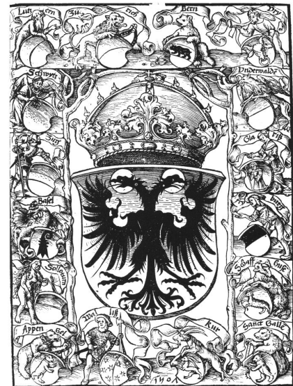
1: Titelblatt der ersten gedruckten Schweizer Chronik von 1507, verfasst von Petermann Etterlin.

der alten Schweizerischen Eidgenossenschaft bildet jenes Holzschnitt-Titelblatt der ersten gedruckten Schweizer Chronik aus dem Jahre 1507, verfasst von Petermann Etterlin, welches in der Mitte allein den nimbierten, schwarzen Doppeladler des Heiligen Römischen Reiches zeigt, um den oben sowie zu beiden Seiten die Wappenschilder der damaligen acht Bündnisorte Luzern, Zürich, Bern, Uri, Schwyz, Zug, Basel und Solothurn sowie Unterwalden, Glarus, Freiburg und Schaffhausen angeordnet erscheinen, ergänzt unten durch die Wappenschilder der vier damals bereits der Eidgenossenschaft zugewandten Orte Appenzell, Wallis, Chur und St. Gallen.