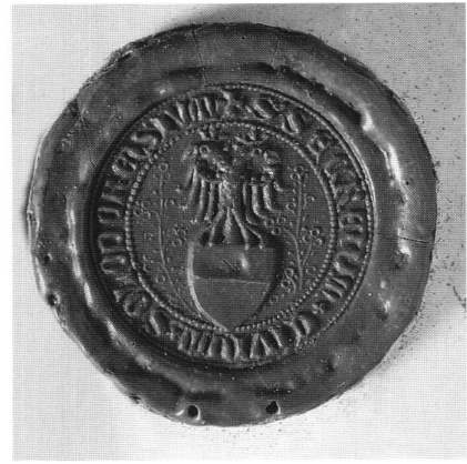
2: Kleines Sekretsiegel der Stadt Solothurn. Erstmals verwendet an einer Urkunde von 1394.

Bisher in der einschlägigen Literatur unbeachtet geblieben ist eine Freskodarstellung des einköpfigen, schwarzen Reichsadlers an der nordwestlichen Aussenfassade der Lenzburg im Aargau, wo dieser Adler ähnlich wie beim obgenannten Berner Stadtsiegel über dem Berner Bären angeordnet erscheint. Die Anbringung dieses Freskos erfolgte auch über Betreiben der Stadt Bern, die bekanntlich im Jahre 1415 den bis dahin habsburgischen Aargau in Besitz genommen hat, wobei die Tatsache, dass man sich hier noch des einköpfigen Adlers bedient hat, darauf hinzuweisen scheint, dass die Anbringung