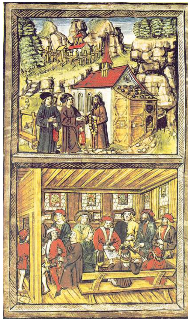
Fin la Dieta da Stans (1481) ha existi la Veglia Confederaziun dals otg chantuns.

L'extensiu da la suveranità territoria – la creaziun da territoris coerents – è en noss intschess surtut stada l'ovra da las citads en la planira. Turitg e Berna eran duas grondas pussanzas. Essend che las duas citads han strusch gi la chaschun a rivalitads