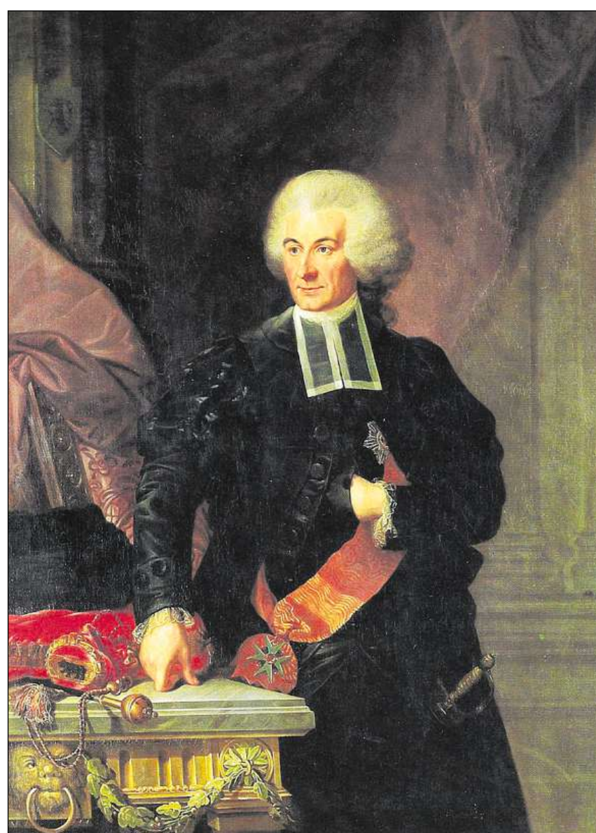
Niklaus Friedrich von Steiger, il davos president da la regenza da la Republica da Berna. (Maletg dal 1792)

La tendenza politica vers ina concentraziun da la pussanza è sa manifestada er en la relaziun tranter um e dunna. Lur rollas en vegnidas normadas; ina litteratura caracterisada d'ideals cristians, la «litteratura dals babs da famiglia», propagava dapi il 17avel tschientaner in maletg da la famiglia che correspundeva strusch a la realitad. Conjugal avevan da viver ensem en amur vicendaivla, avevan da fumar ina cuminanza dals bains e da trair si cuminaivlamain lur uffants. Sco chau da la famiglia valeva l'um che dueva, grazia a sia raschunavladad, diriger dunna ed uffants. Vers la consorta demussava el pazienza, essend ch'ella appartegneva per motivs morals ed intellectuels a la «schlattaina flaiivla». En realitad vegniva il mingadi da la famiglia dentant determinà da las diras relaziuns economicas. La rait sociala aveva anzas fitg largias. Tgi che crudava tras era dependent d'almosnas e da