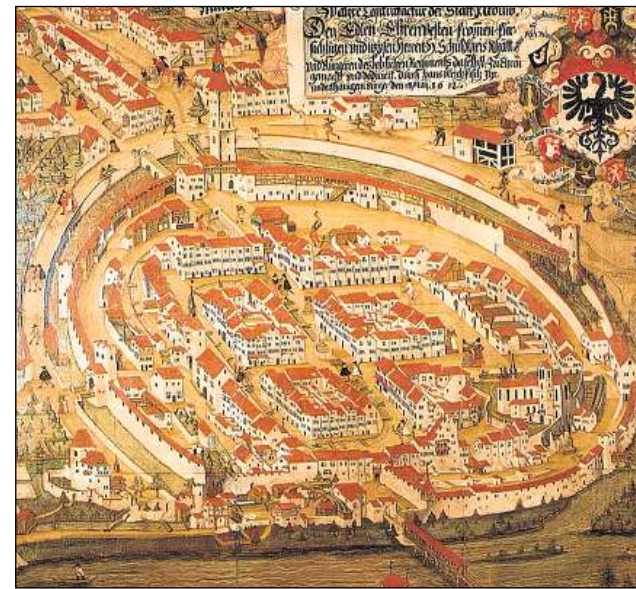
Vista da la citad dad Aarau (1612).

Praticamain tut ils mastergnants appartegnevan ad ina mastergnanza u ad ina so-