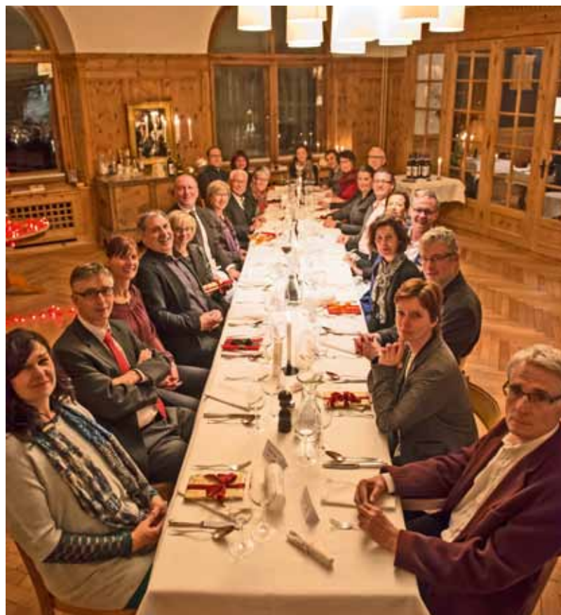
La suprastanza SRG.R e la direcziun RTR gaudan l'atmosfera speziala en la sala da l'Hotel Piz Linard a Lavin.

(mt) Il matg, il settember ed il december 2013 èn l'anteriura chasa da scola e l'Hotel Piz Linard stads ils lieus da retratga e da planisaziun per la direcziun RTR e la suprastanza SRG.R. Igl èn vegnids instradads projects che vegnan ad occupar RTR durant ils proxims onns. Il project central, cun il qual ils differents gremis èn s'occupads a Lavin è l'uschenumnà "digital shift" – il consum da medias capita adina dapli en la rait e la lavur da schurnalistas e schurnalists sto s'adattar a quest trend.