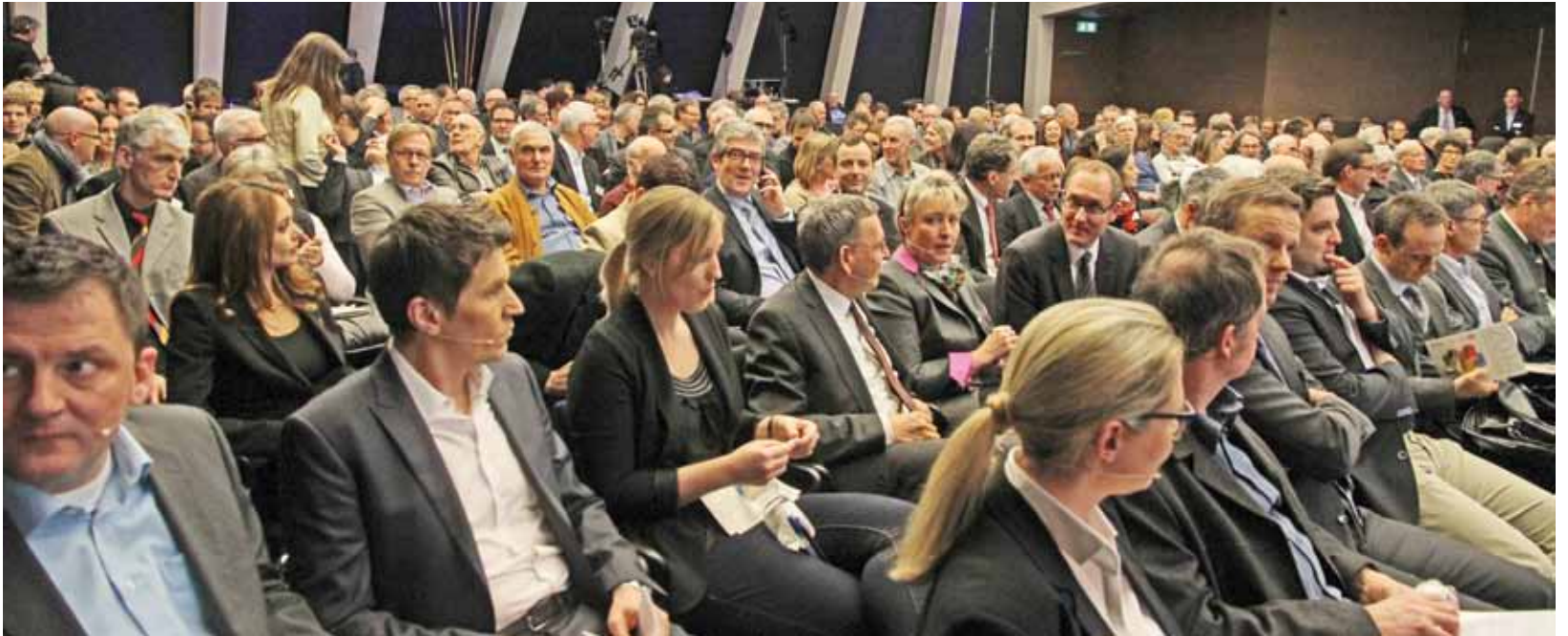
L'interess per l'arranschament d'elecziun è stà grond. L'Auditorium da la Banca chantunala è stà occupà fin il davos plaz.