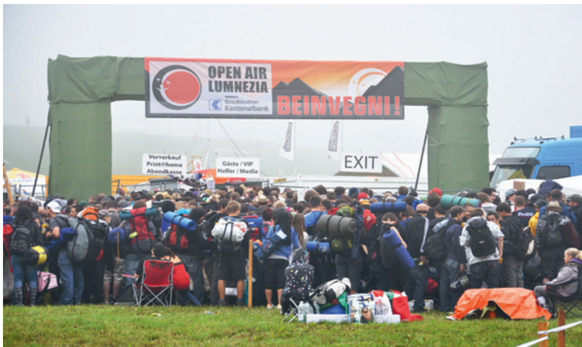
Ils fans da l'Open Air Lumnezia arrivan ad ura per chattar in bun plaz.