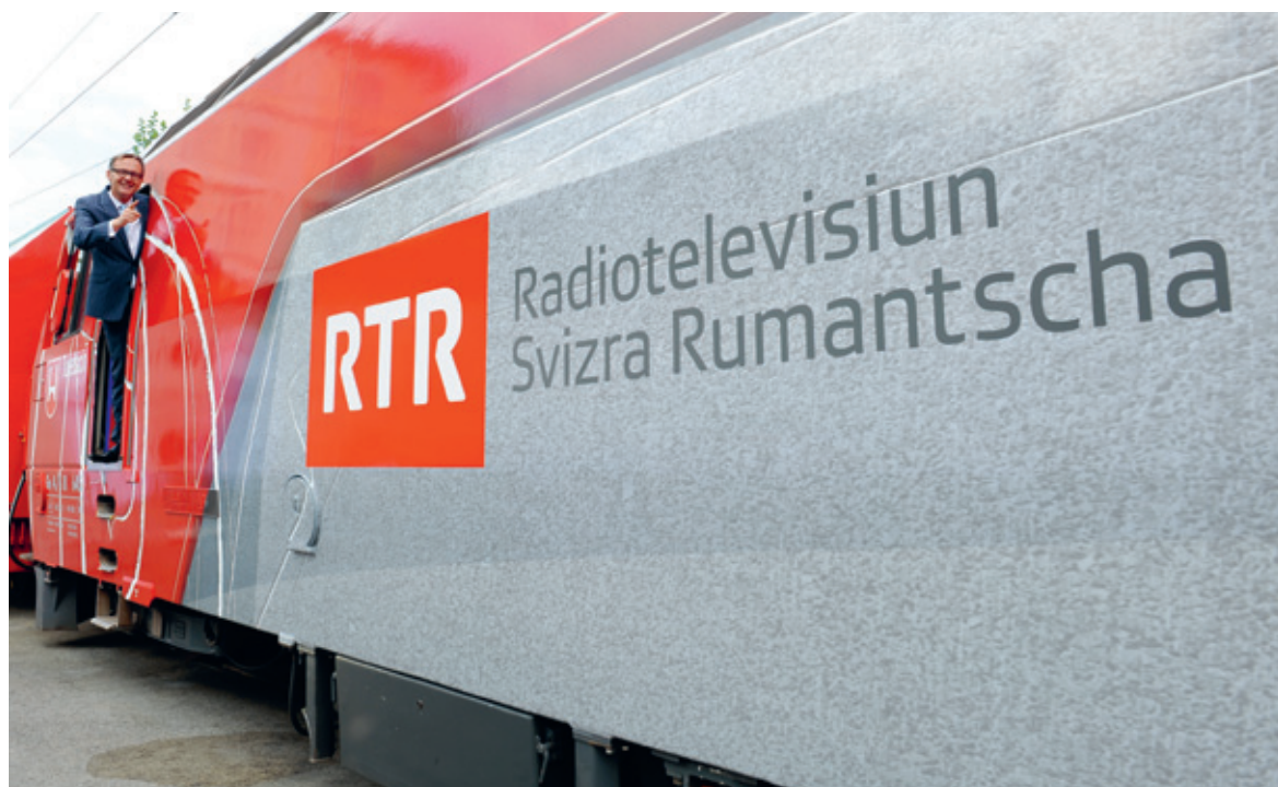
Nov schlantsch per RTR cun ina locomotiva che muventa e dinamisescha.