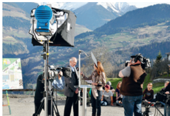
... a Ruschein ...