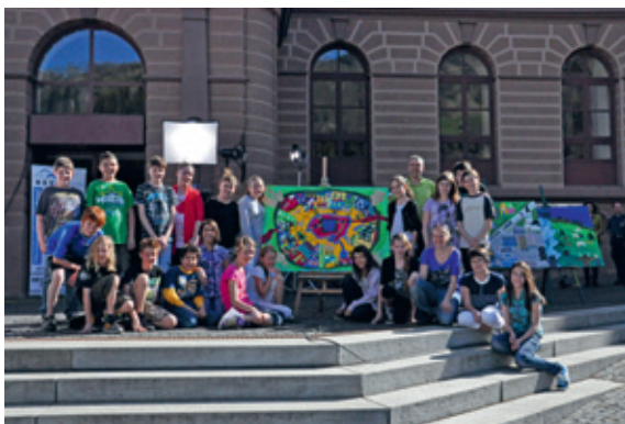
... a Glion ...