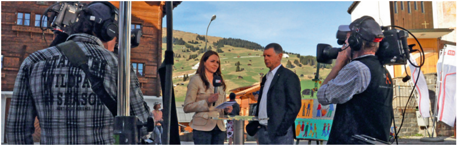
RTR Radiotelevisiun Svizra Rumantscha ha tschertgà il contact cun la populaziun a Breil...