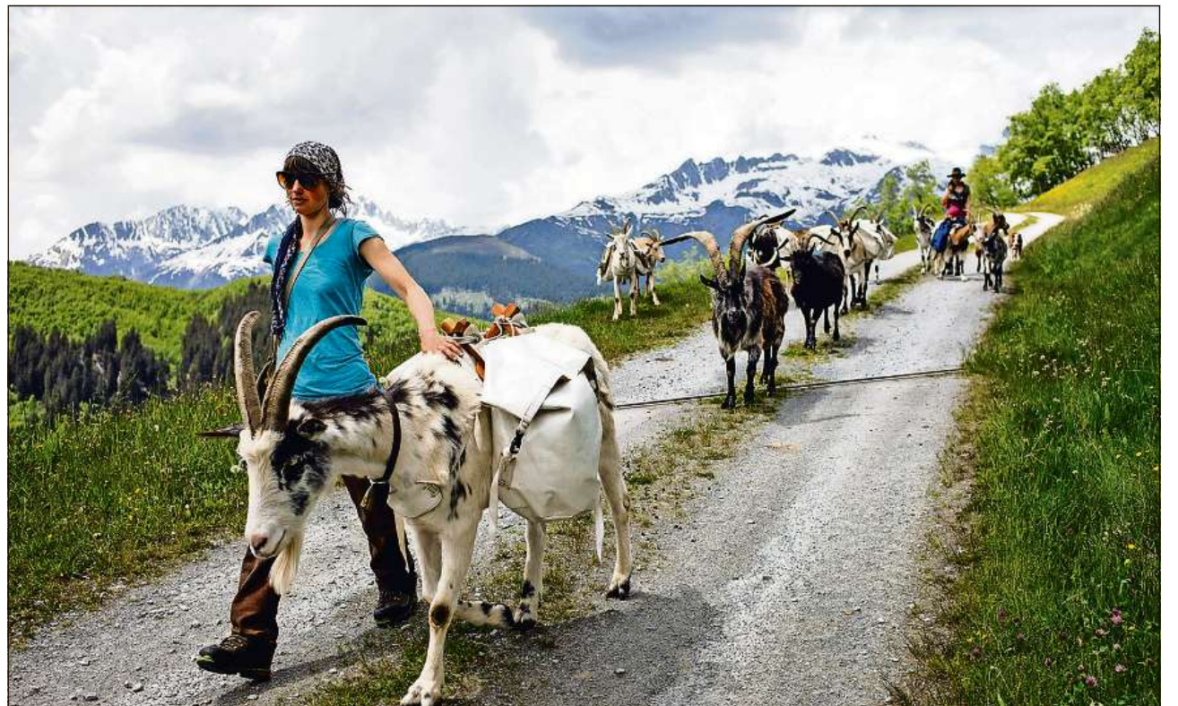
Turas da trekking en Val Medel senza satgados – las chauras portan la bagascha.

Il temp da scola, cunzunt la matematica, saja stà ina tortura, sa regorda la pura. Persuenter haja ella autras abilitads: «Jau hai in fin sentiment per chaussas che auters na vesan u chapeschan forsa betg uschia. Jau sent sch'i na va betg bain cun in uman u in animal.» Uschia remartga ella adina sche ina da sias chauras fa prest