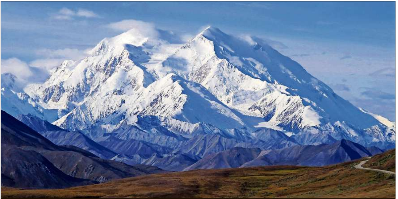
Barack H. Obama ha rebattegià il piz gigantic en Alasca da Mount McKinley sin il num tradiziunal Denali.