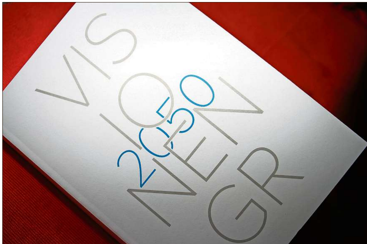
Dapi oz en vendita: Il cudesch «Visionen Graubünden 2050».

En sia dissertaziun saja el s'occupà cun l'istorgia grischuna, ha ditg Rathgeb. En ses onn presidial sco president da la regenza haja l'avegnir dal Grischun adina fatschentà el, ha ditg l'editur dal cudesch «Visionen Graubünden 2050». Inspirà da realisar quel project haja dentant er sia participaziun al Forum mundial d'economia a Tavau, ha menziunà Rathgeb. La regenza grischuna haja preschentà il program 2017–2020 ed er quel saja stà la basa per laschar metter en palpiri pliras persunas lur visiuns sco ch'il Grischun savess vesair or il 2050. Enconuschentamain na dependa il futur betg mo da quai che nus faschain, mabain er da quai che nus tralashain, manegia il