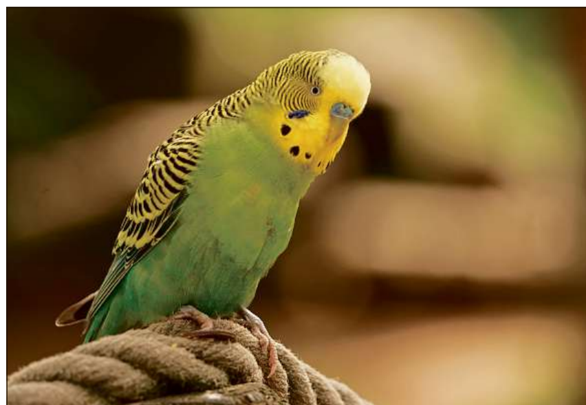
Mintga spezia d'animal tschenta sias atgnas pretensiuns a la tegnida e tgira.

Animals pitschens che na paisan betg daplì che 10 kg dastgan vegnir sepulids libramain, ma sut la cundiziun che tschertas mesiras da precauziun vegnian observadas: La fossa sto esser profunda avunda ed en ina distanza segira da l'aua (protecciun da l'aua sutterrana e dals curs d'aua). In animal dastga vegnir sepulid sin l'agen terren u en lieus ch'èn previs per quest intent e ch'han l'autorisaziun necessaria. En Svizra datti differents «santeiris per animals». Ils chantuns han plinavt installà lieus per cremar cadavers d'animals. Per adressas e per infurmaziuns davart la moda da proceder pon ins sa drizzar ad in veterinar u a las organizaziuns per la protecciun dals animals.