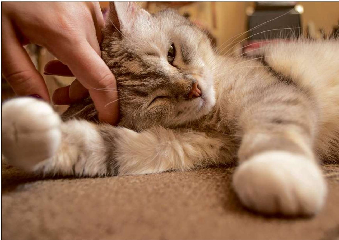
Il giat è l'animal da chasa il pli frequent en Svizra.

Avant che sa decider èsi inditgà da studiar ils signalaments dals differents animals da cumpagnia. Quels decleran chaussas interessantas davart il tegnair animals sco er davart ils custs, davart la