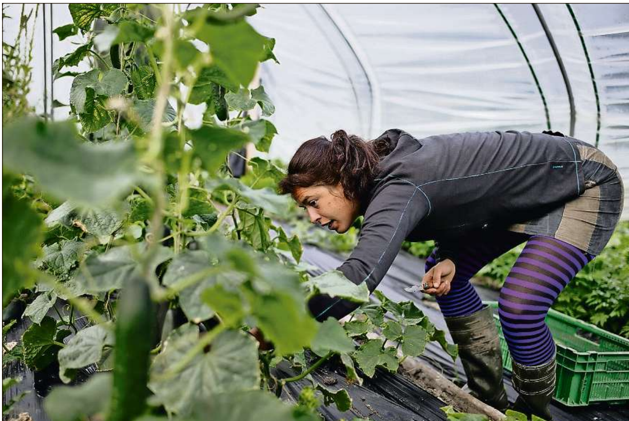
Dapi ch'ella ha dus tunnels da folia madireschan las tomatas era cun mo paucas uras sulegl a Farera.

ansiel. L'ura la damaun marvegl durant mulscher sias chauras sin pastira è per ella il pli bel mument dal di.