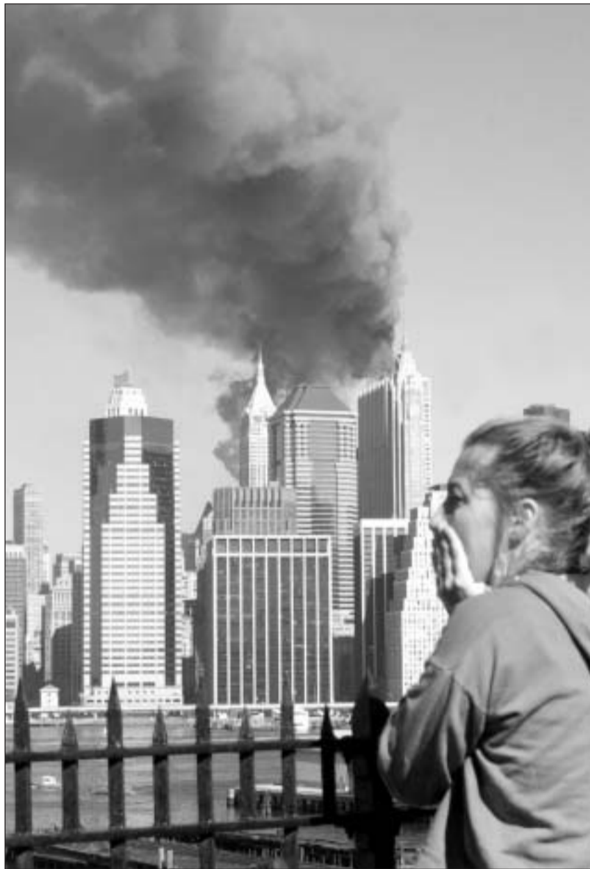
Purtrets che han schoccà il mund. Ils «Twin Towers» dal World Trade Center a New York stattan en flommas ils 11 da settember 2001.

Per l'emprima acziun dals SU encunter in pajais islamic han ins dà la culpa lezza giada a la Gronda Bretagna. Pir dapi 2000 san ins ch'igl è stà vairamain l'ovra da la «Central Intelligence Agency» (CIA) americana e che Londra l'ha be furnì l'ocasiun d'agir. «Suenter la