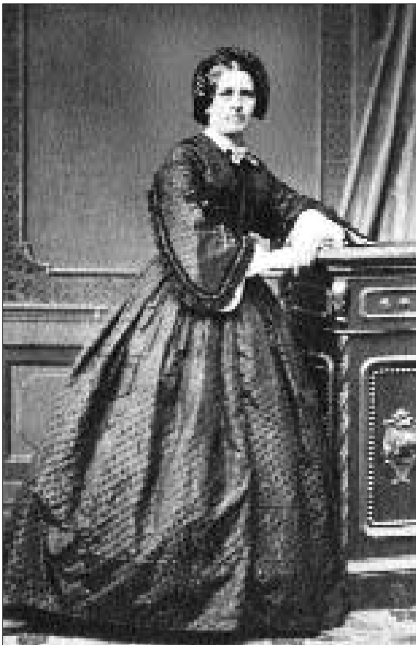
Johanna Spyri, l'autura da Heidi.