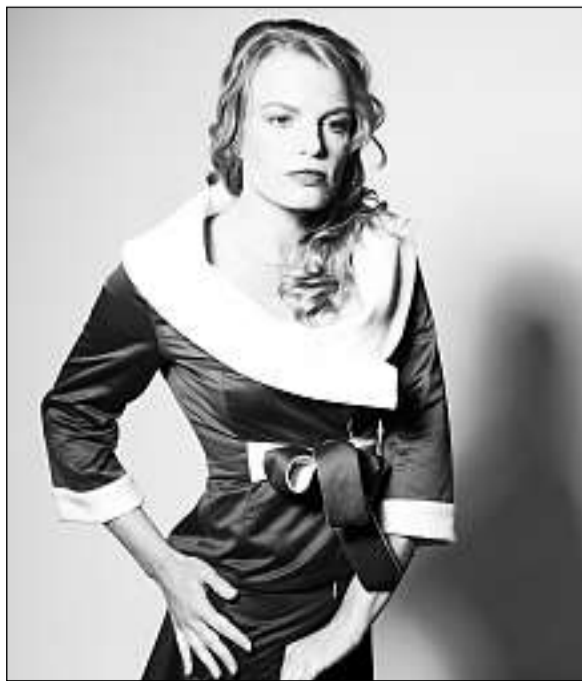
In exempel da la collecziun d'enviern dal label «deflorin».

Naschida: ils 4 d'october 1968 Creschida si: a Mustér Clamada: designera da moda Colur preferida: nair (per vestgadira) Stil preferì: simpel ed elegant Vestgì preferì: mantel Designer preferì: Yohji Yamamoto e Vivienne Westwood Pajais da vacanzas: Frantscha