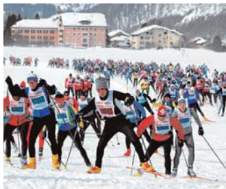
Maraton da skis d'Engiadina: la «serp» passa Segl.

prims skis vegnids en nossas regiuns. Siglieras e vials da bob èn vegnids construids. Attracziuns per in turissem naziunal ed internaziunal eran pia tuttenina avant mauns en las muntognas grischunas ed han fatg or da questa regiun ina da las pli veglias destinaziuns da sport d'enviern en l'Europa.