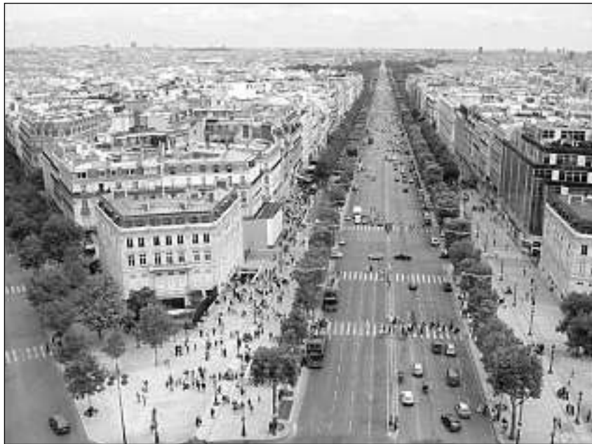
Ils Champs-Élysées a Paris.

L'emprim duain ins declarar insaquants puncts da la carta politica ed etnica da l'Europa centrala ed orientala avant duatschient onns. La Russia cumpigliava intschess da plis stadis oz independents, t. a. la Bielorrussia. Ina part da Pologna furmava il gronducadi da Varsovia, attribui da Napoléon al retg da Saxonìa. Quest davos pajais, cun auters reginams tudestgs (Baviera e Württemberg) ed il gronducadi da Baden, furmava la Confederaziun renana, vasalla da Napoléon e che stueva metter schuldada a disposiziun per sias guerras. La Frantscha occupava militarment il reginam da Prussia (chapitala Berlin), il qual cumpigliava las pli grondas parts da Brandenburg, Pomarania, Prussia da l'ost e Silesia. L'Austria imperiala era bler pli gronda che la republicana d'oz; ella cumpigliava t. a. la Boemia, patria da la schlatta nobla Schwarzenberg: In Karel Schwarzenberg è anc oz minister da l'exteriur en