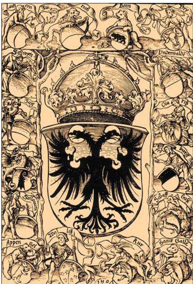
La Confederaziun cun ils Lieus aliads (1507).

Il LIR cumpiglia bundant 3100 arttgels (geografics, tematics, arttgels da famiglias e biografias) davart l'istorgia grischuna/retica e la Rumantschia. Editura: Fundaziun Lexicon Istoric Svizzer; versiun online: www.e-lir.ch ; versiun stampada: www.casanova.ch u en mintga libreria.