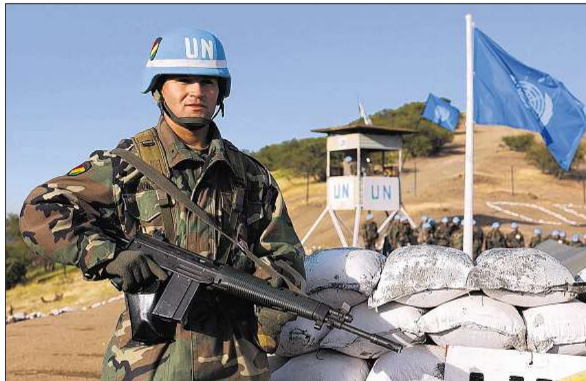
Chapellinas blavas da las Naziuns unidas sa preparan en il Chile per lur proxim servetsch.