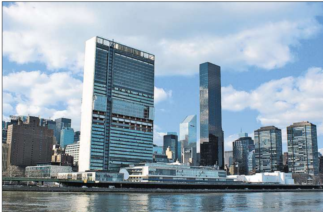
Sedia principala da l'ONU a New York.

Ils sis organs principals da l'ONU en: L'Assamblea generala: Ella furma l'organ politic central da l'ONU. Ella fixescha las finamiras, s'exprima davart schabetgs, relascha las directives per ils organs spezial e per ils programs, nominescha il secretari general, fixescha las quotas da la contribuziun ed approvescha il budget da l'ONU. Ella sa raduna annualmain;