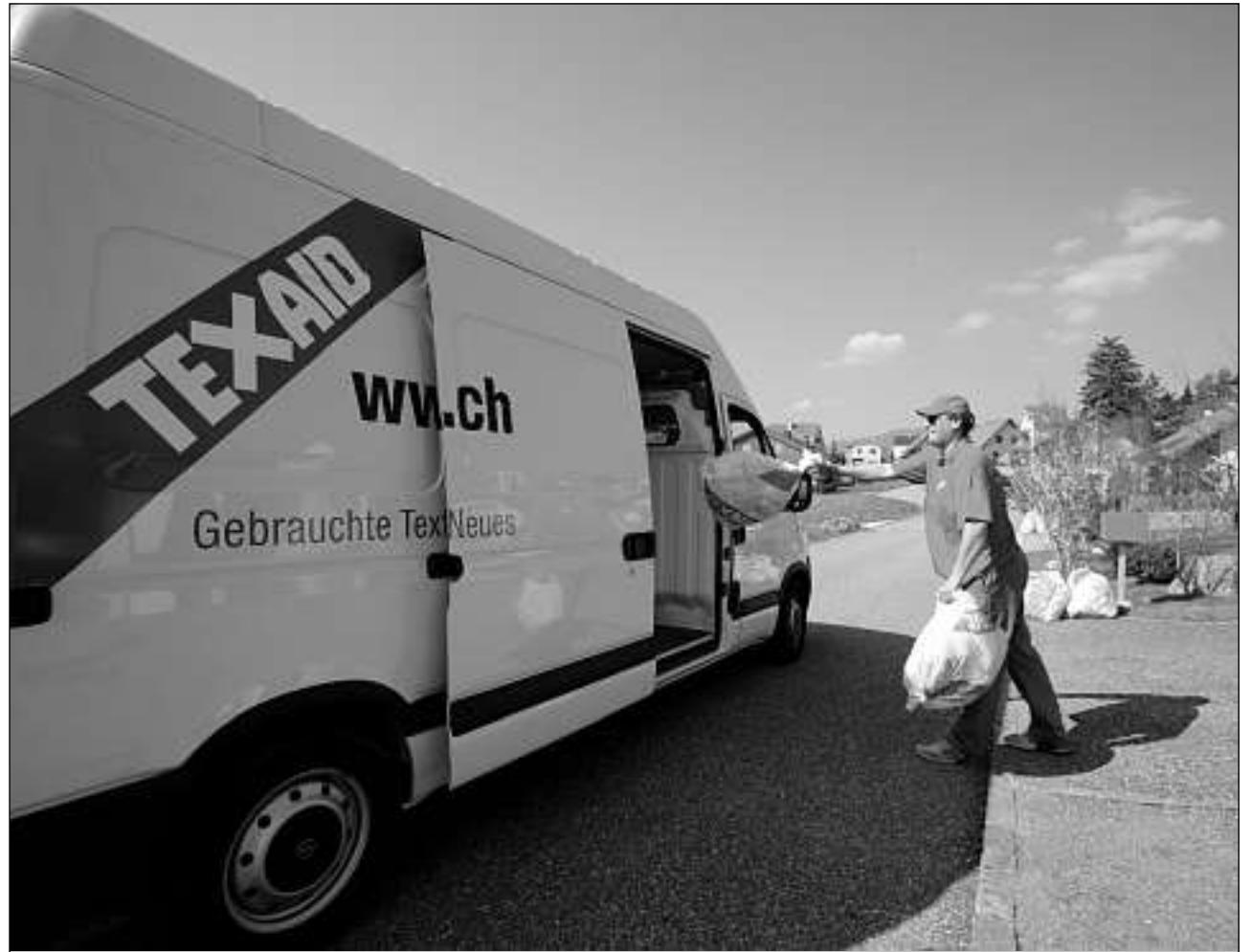
Il team da logistica che dispona da sistems da direcziun ils pli moderns rimna ils satgs da Texaid semtgads sper via.

Vestgadira, chalzers e textilias dal tegnaichasa bain mantegnidas chattan clients engraziaivels en pajais economicamain flaiVELS, en ils quals textilias novas èn sproporziunadamain charas en congual cun las entradas. Textilias da segund maun che derivan da la Svizra èn d'alta qualitad, fitg modernas e – tge ch'è zunt impurtant – era pajablas. La pli gronda part da las textilias vegn cumprada oz dals pajais en l'Europa da l'Ost, en l'Orient Extrem ed en l'Africa. Textilias da mangola defectas (vestgadira e textilias dal tegnaichasa stgarpadas e plain tacs, uschiglio però schubras) na pon betg pli vegnir purtadas ed utilisadas. Perquai vegnan ellas elavuradas en la citad ungaraisa Eger dad Algotextil, ina societad affiliada a Texaid, en sdratschs da nettegiar industrials. Tut las ulteriuras textilias ch'ins na po betg pli utilizar en la furma actuala tutgan tar la rauba da recicladi: vestgadira da launa defecta, mantels, unifurmas, cuvrias, etc. Tut tenor qualitad vegnan las textilias da launa stgarpadas, nettegiadas, filadas da nov ed elavuradas a nova vestgadira ubain a cuvrias e material d'isolaziun. Ils stgars diesch pertschient restanzas betg utilisablas cumpiglian vestgadira sintetica defecta, textilias tartagnadas, singuls chalzers, termagls ruts, rauba dal tegnaich-