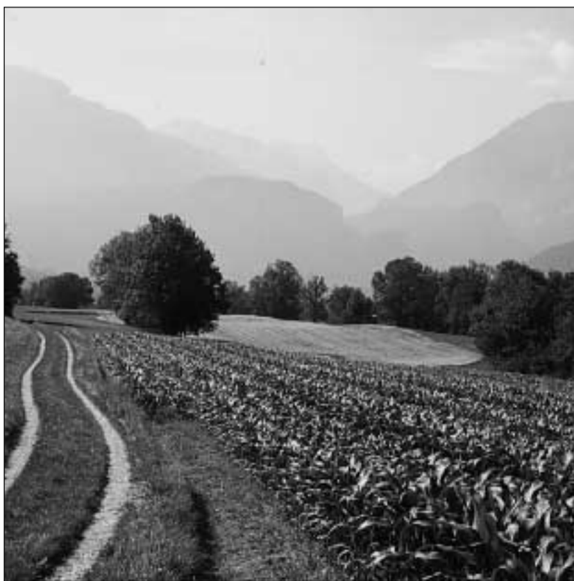
La pulenta che vegn el taglier n'è betg manipulada geneticamain.

Ils trais gronds mulins da pulenta en Svizra inditgeschan tuts ch'els lavuran be cun pulenta na manipulada, la pulenta «Plata» da l'Argentina. Els survegnan mintgamai certificats che garanteschan che la semenza saja libra da sems midadas. Il mulin a Steinen inditgescha ch'ins laschia mintgamai analizar la rauba importada. Era il mulin Zwicky SA a Müllheim-Wigoltingen proceda en medema guisa. Enfin uss n'hajan ins per cletg mai stuì constatar tar ils tests che la pulenta fiss stada tartagnada. En la «Stadtmühle» a Turitg vegnia fatg emprovas da controlla. Il responsabel da Turitg fa dentant era attent sin la problematica dals tests. En tuts trais mulins remartgan ins ch'i na saja fin uss betg enconuscent che il tirc da «Plata» vegnia substituì cun ina sort manipulada geneticamain. I sa tractia qua era dad ina sort da tirc dir. Ma sch'i vegniss in di adaquella, alura na pudessian ins srusch sa dustar encunter quai.