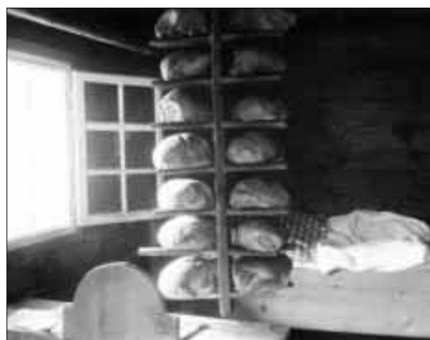
Tgi che nun aveva pli lieu en chaminada pitgava si la pandegia là nua ch'i era anc lieu, per exempel en stanza da durmir!

En il medem statut statti er: «Mintgin dei haver quitau de buca scaldar il fuorn memia». Quai betg or da quità per il paun, ma per il furn: quel pudess survegnir sffesas. Ins consumass er ina pluna laina senza pudair propi trar a niz quella, pertge ch'il furn sto puspè sfradar giu, enfin ch'el ha la buna temperatura per enfurnar il paun.