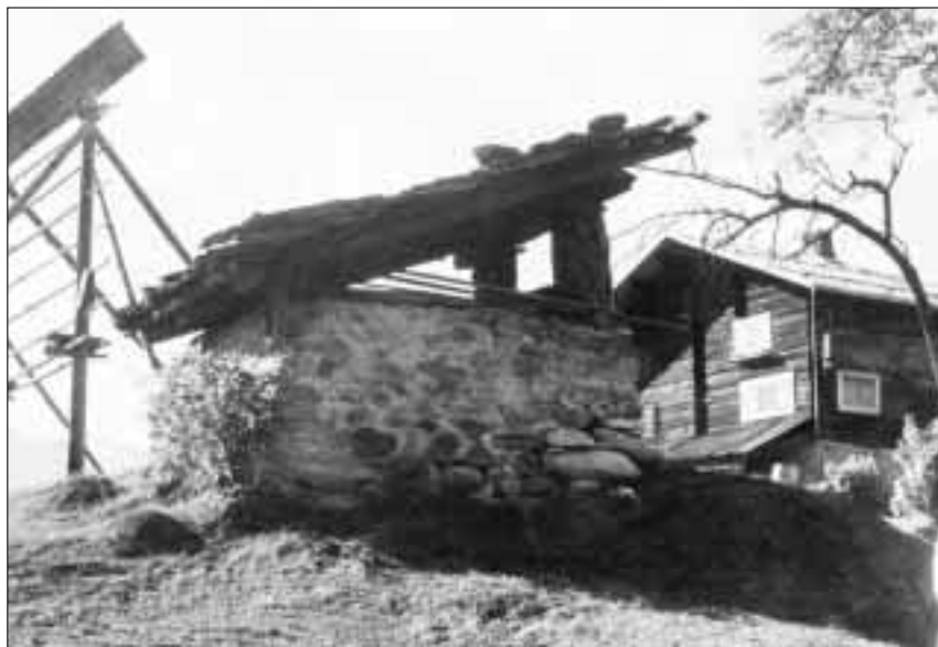
Pastrign a Sursaissa. Quai è ina simpla chamona cun in furn lien per coier il pan. Pel solit serviva quel a pliras chasadas, tenor urden da roda.