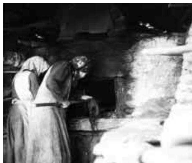
A l'intern dal pastrign. La dunna a dretga tegna en maun in scuflun, in bastun lung cun in sdratsch vidlunder, che vegniva fatg bletsch per nettegiar ora il furn chaud.