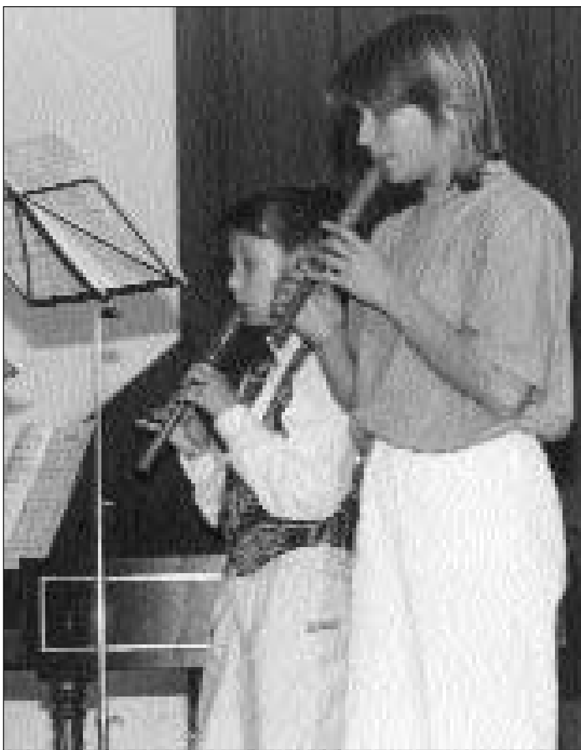
La musica, la pratica d'instruments e l'educaziun musicala megliereschan l'intelligenza zunt fitg ed a la lunga.

In emprim avantatg ha sa mussà tar ils uffants da nov fin a dudesch onns. Pir en lezza vegliadetgna han ils perscrutaders constatà: «La musica, la pratica d'instruments e l'educaziun musicala megliereschan l'intelligenza zunt fitg ed a la