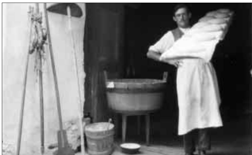
En general era far paun la lavur da las dunnas. Qua vesain nus in giuven pasterner en giadinaiis turnà da l'ester (Zerne 1921).