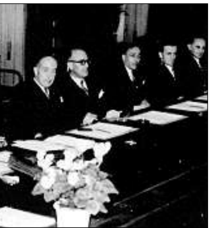
La delegaziun svizra durant las tractativas cun ils alliads, mars 1945.

Suenter diras contractivas èn ils alliads sa declerads pronti da desister da tuttas pretensiuns envers la regenza svizra e la BNS en quai che pertutga las transacziuns d'aur fatgas da la Svizra cun la Germania durant la guerra. Persuenter due-