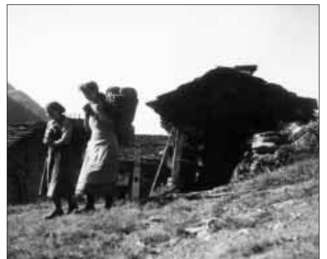
Mattas da Vrin che turnan dal pastrign cun ina buna chargia sin la rain. Questa fotografia è vegnida fatga en ils onns 40.

Silla fotografia survart ves'ins las differentas iseglias per il furn da paun. Da sanester a dretg: il schlavun u scuflun cul sdratsch vidlunder, la pala da fier, la pala da lain ed il ruschen.