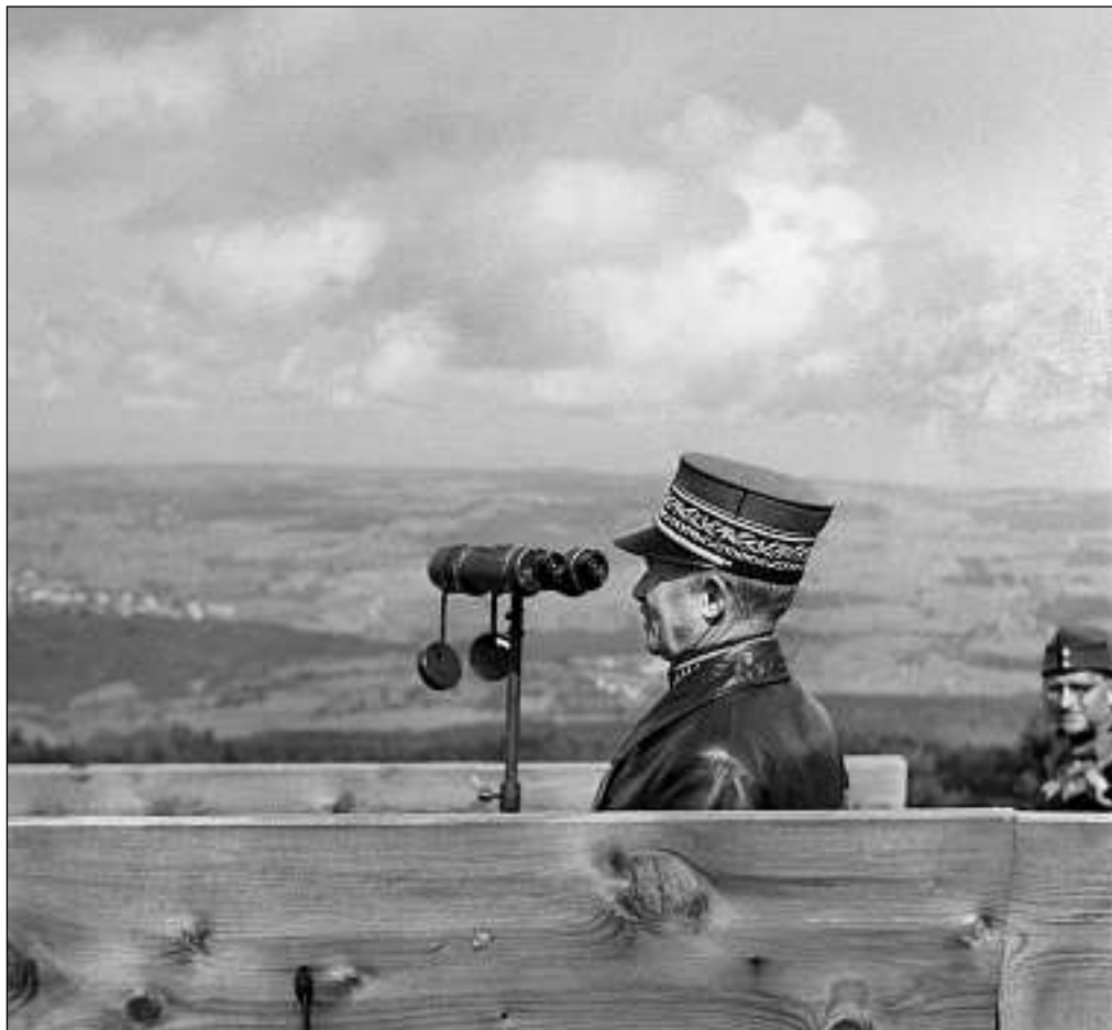
Tge saveva la Svizra davart l'aur dals nazis? General Guisan al cunfin.

Suenter che la Germania aveva provocà la Segunda Guerra mundiala duvrava ella adina dapli materias primas essenzialas per la guerra. Ina da quellas era il wolfram che vegniva explotà surtut en il Portugal. La Germania duvrava perquai escudos ch'ella sa procurava en barat cun aur tar bancas comercialas svizas. Quest aur vegniva alura vendi sin il mar-