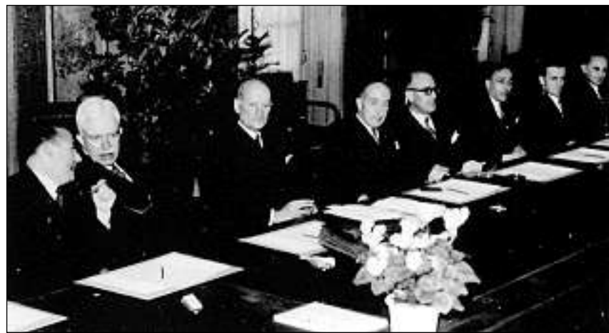
La delegaziun svizra durant las tractativas cun ils alliads, mars 1945.

2. Aur da victimas assassinadas u surviventas da la politica d'extirpaziun dals nazis (aur da victimas).