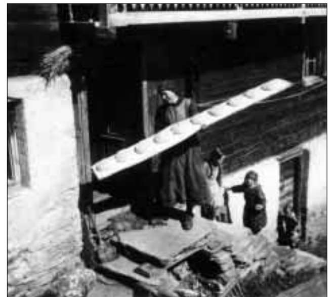
Per ils uffants èsi natiralmain impurtant da vesair nua che l'assa cul paun fa viadi! (Vrin)