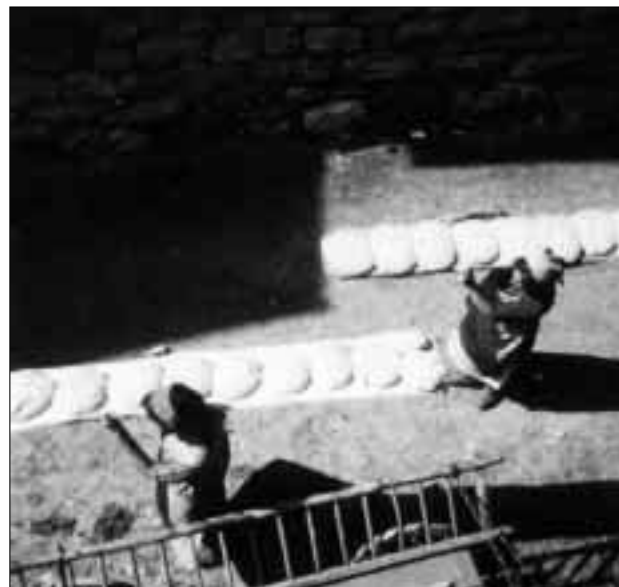
Duas dunnas da Vrin portan lur paun bain levà al pastrign. Sin in'assa da paun avevan plaz 10-12 pauns.