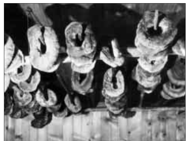
Il paun vegniva fatg en differentas furmas: A furma da rasdira, da bratschadella (sco qua survart) o lunghent.