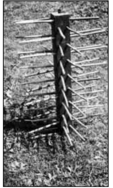
Ina pandegia vida. Quest sistem da «erizun» permetta da lugar il paun enturn ed enturn il pal central. La pandegia ha sisum ina rincla da fier e vegniva pitgada si en in lieu frestg en chasa, uschia che las mieurs na pudevan betg rusignar vi dal paun.

Las suandantas fotografias èn or da la fototeca dal DRG, e la gronda part cumpara qua per l'emprima giada.