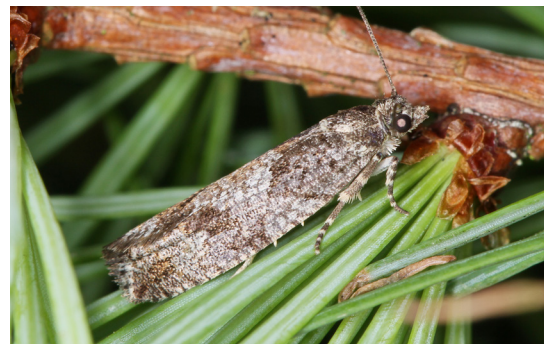
L'animal creschi dal splerin da laresch.