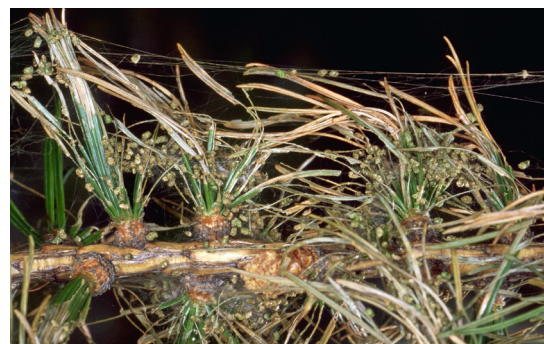
Guglias ruisas fermamain cun excrements e fils filads.