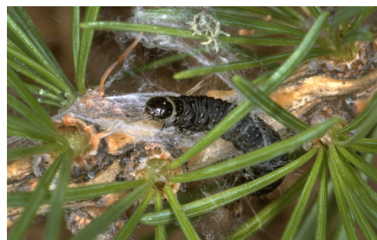
La rasulauna grisch stgira dal splerin da laresch.