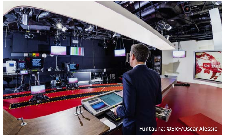
Funtauna: ©SRF/Oscar Alessio

La SSR e sias unitads d'interpresa furman emprendistas ed emprendists motivads e principiants en il mund da lavur en differents secturs e lieus. Mintg'onn lavuran en la SSR circa 50 emprendistas ed emprendists e var 80 praticantas e praticants. Plinavant survegnan mintg'onn radund 70 stagiarias e stagiaris (stagiarias e stagiaris fan ina scolaziun schurnalistica complementara a la professiun, savens al MAZ a Lucerna) la schanza da cumenzar ina carriera schurnalistica.