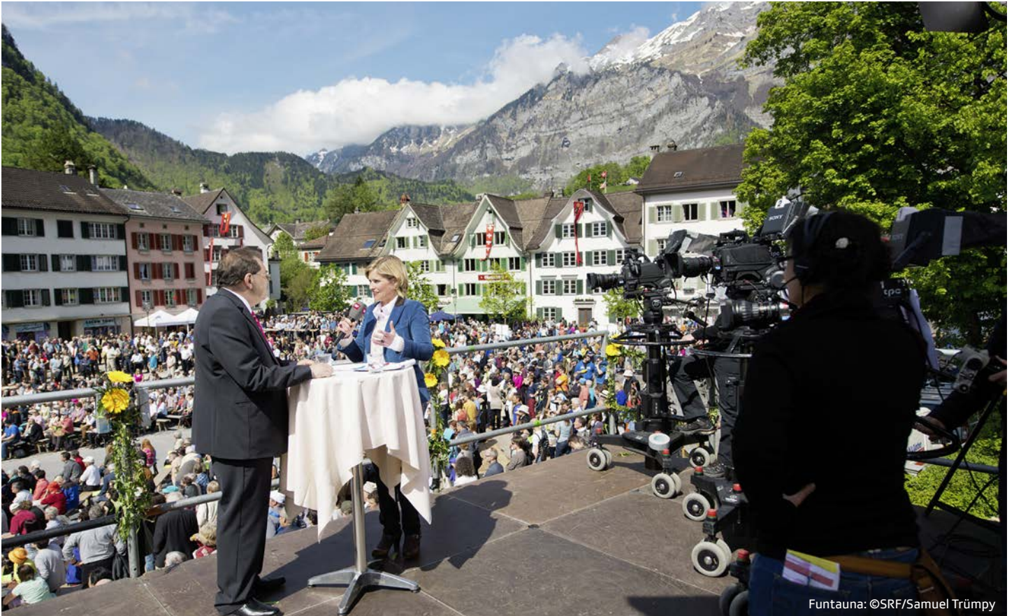
Funtauna: ©SRF/Samuel Trümpy