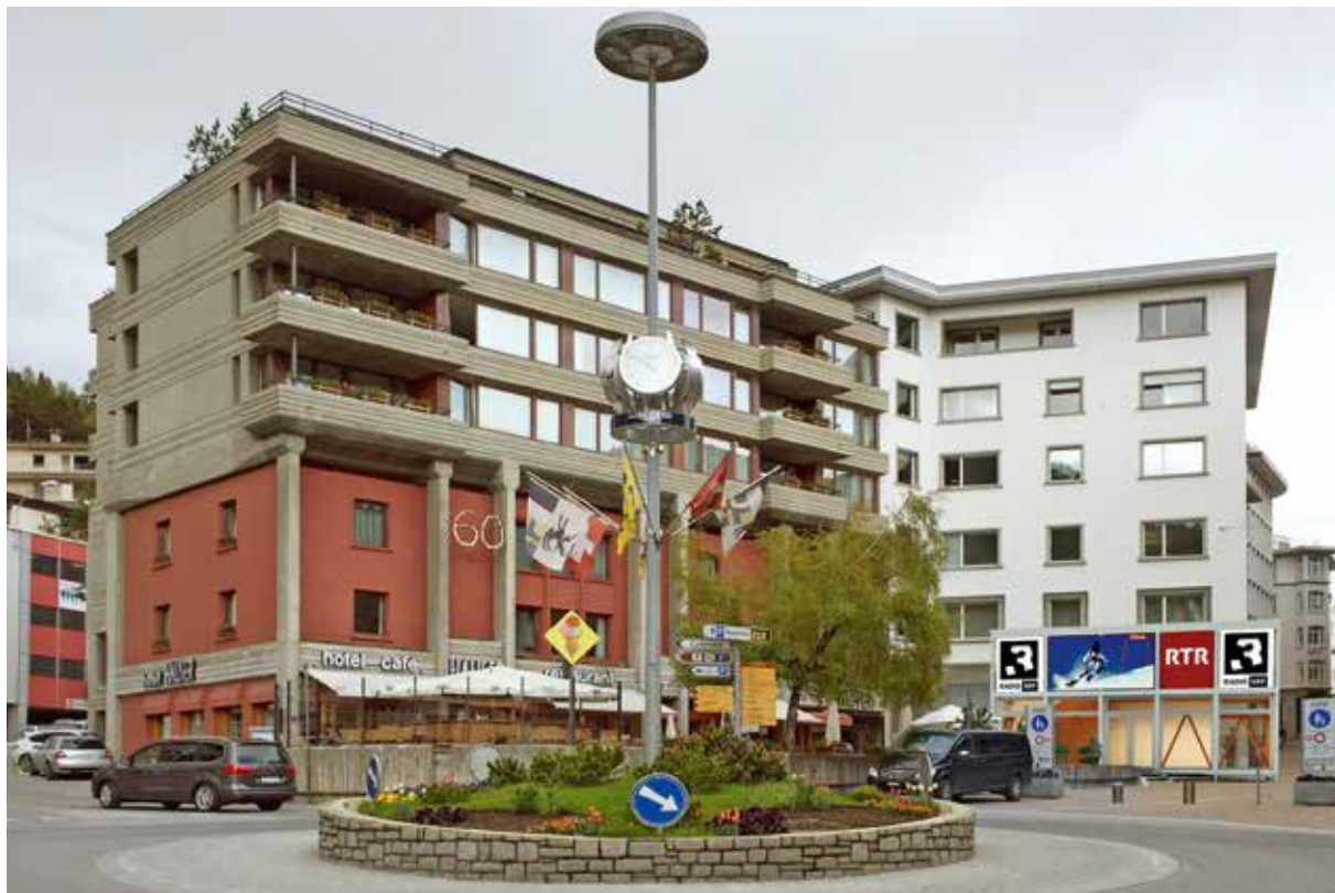
Ensemen cun radio SRF3 sa preschenta RTR davant il café Hauser a San Murezzan.

Ensemen cun radio SRF3 sa preschenta RTR davant il Café Hauser. Visitadras e visitaders pon dar ina baterlada, participar al giu da tippa, sa sentir sco in atlet e participar ad ina cursa da skis virtuala cun egliers da 360°. En il studio s'inscuntran collavuraturas e collavuratur da RTR e da SRF3 cun la populaziun da San Murezzan ed ils