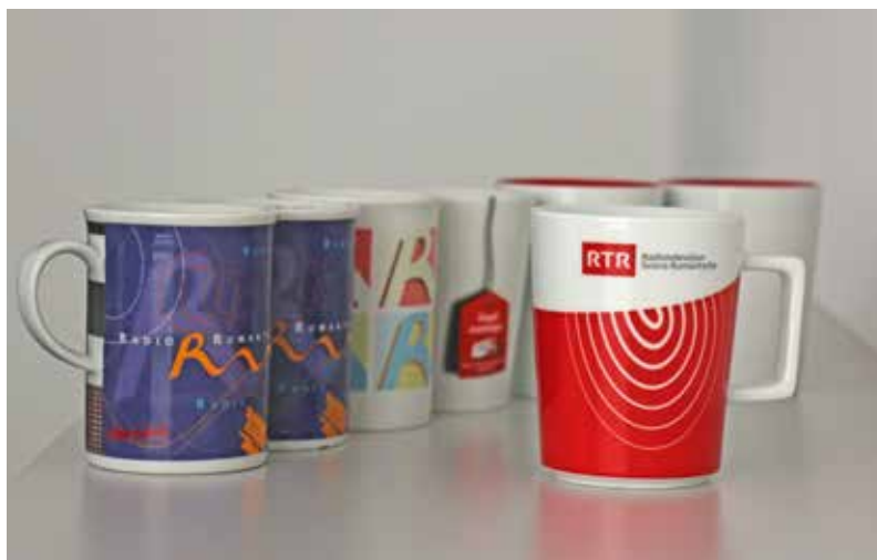
Ils 7 differents models da la coppina dal Radio Rumantsch.

Dapli davart las gratulaziuns u la coppina chattais Vus sin rtr.ch.