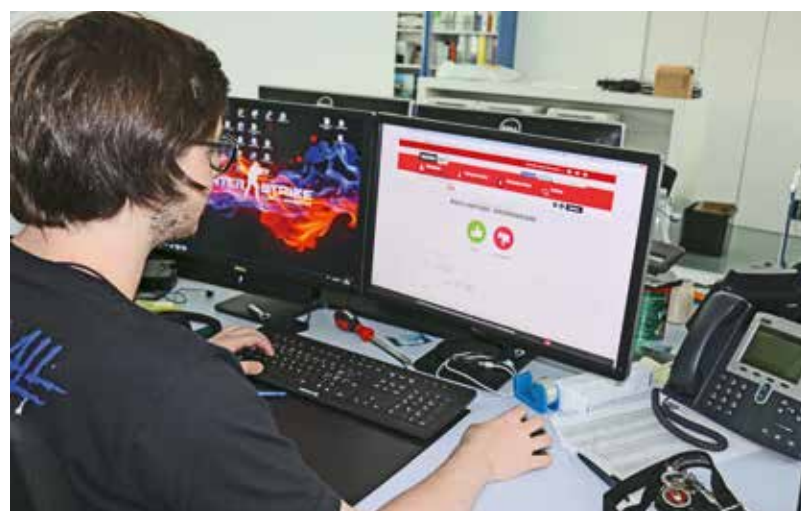
Er en chasa RTR vegn respondi a las dumondas da «Generation What?».

Naturalmain na dat il questunari betg in purtret represchentativ da l'Europa e da la Svizra. El mussa