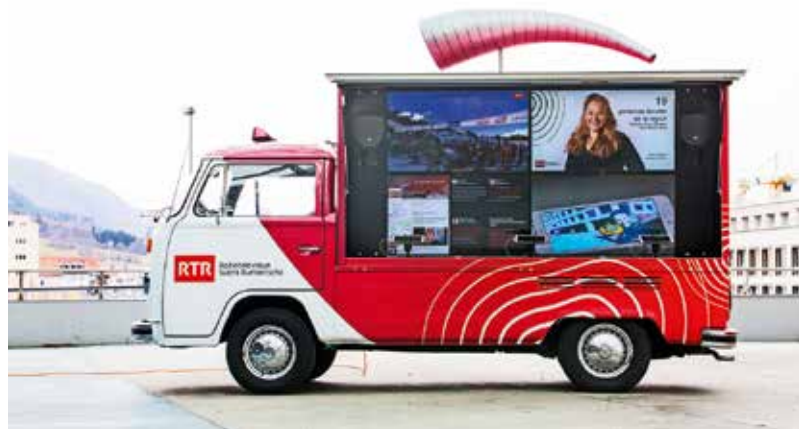
Era la Microlotta da RTR, in bus da 38 onns, è preschenta a l'ILHGA 2016.

La Microlotta, in bus da 38 onns, è equipada cun infrastruttura d'audio, da video e da multimedia. Sin in