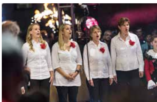
Las dunnas dal chor «chursüd» durant la produziun da l'imni naziunal.