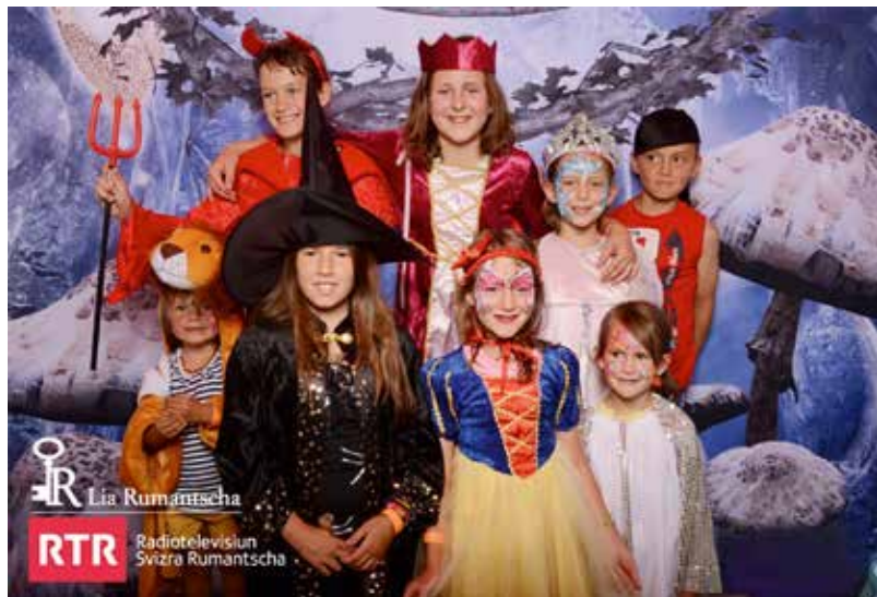
Liuns, diavelets, strias e princessas unids en armonia paschaivla per la foto da regurdientscha. Dapli fotos sin photocab.ch.