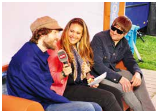
En discurs cun commembers da la gruppa «kaiser chiefs».