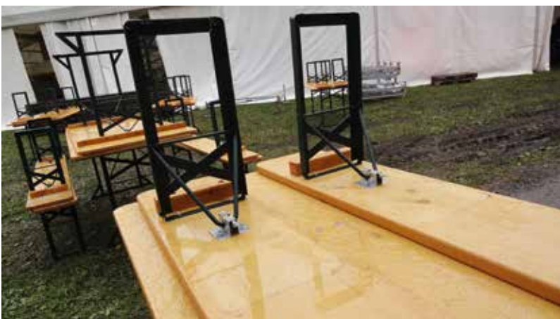
Il scenari en cas da malaura n'è per fortuna betg vegnì duvrà.

L'emissiun naziunala dal 1. d'avust pon ins guardar anc ina giada sin il player da SRF www.srf.ch/player/tv