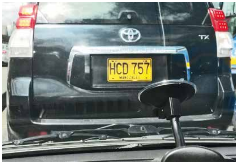
Vesi sin las vias da la chapitala da la Columbia Bogotá.