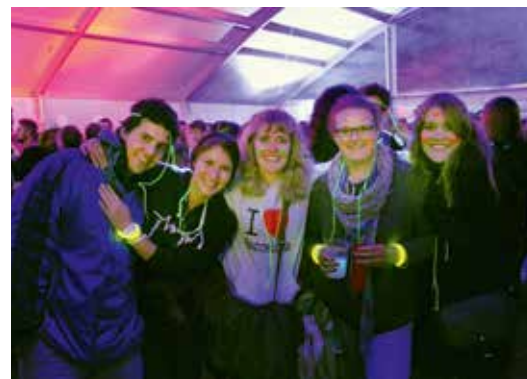
Success cumplain per la battaparty da battaporta.