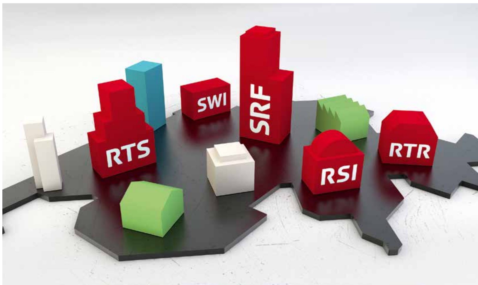
La Societad Svizra da Radio e Televisiun SRG SSR – ina part da la varietad da medias svizra.

La SSR è ina societad privata manada tenor il dretg da la societad anonima cun in'incumbensa sociala particulara (concessiun). Ella gestiunescha in'interpresa da medias per ademplir questa incumbensa.