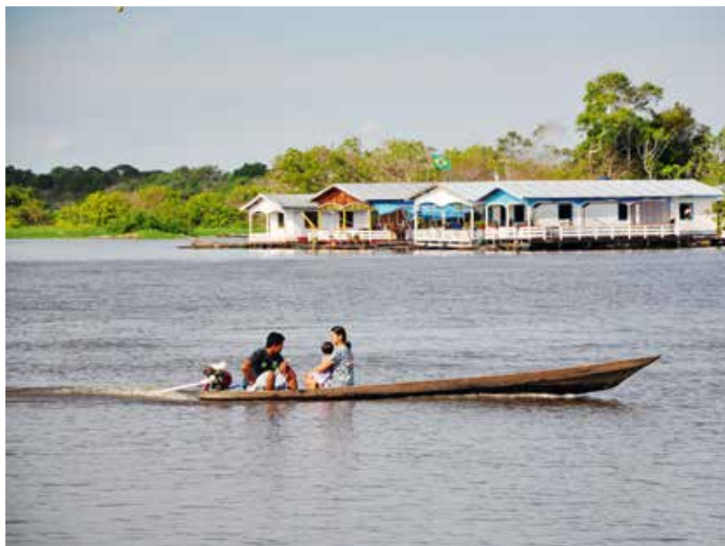
Cuntrasts brasilians: la vita ruasseivla sin la champagna e la hectica d'ina fieria en la citad.