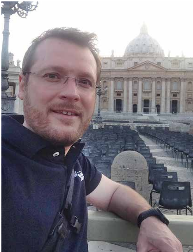
Ina visita al Vatican cun la piazza da son Pieder na dastga betg mancar durant ina dimora en la citad perpetna.