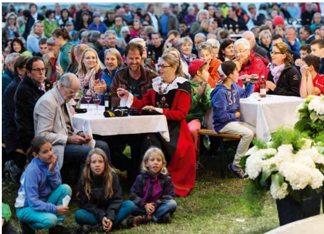
In pievelun ha assistì a l'emissiun naziunala, emessa directamain da Zernez.