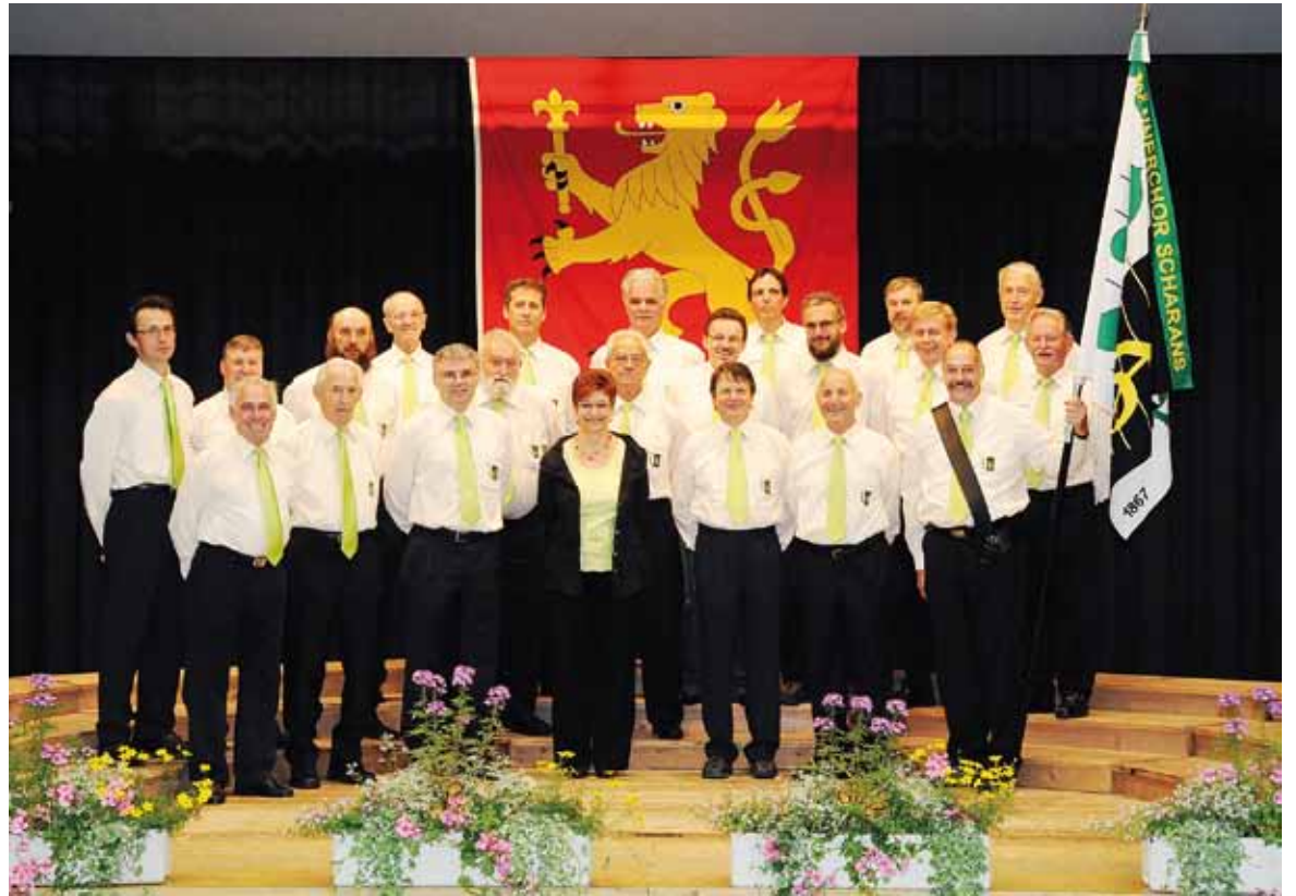
Il Chor viril Scharons embellescha la saira.

(ggd) Las 8 cumenza il program da la saira cun chant, musica e films. En il center stattan quatter furmaziuns e differents partenaris d'intervista. Uschia sa preschentan ils Muhafreaks Masein, scolaras e scolars da la 4.-6. classa da Masein cun lur sunas