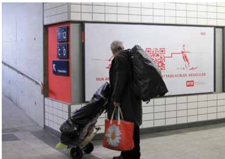
Viagiatur è adina en prescha, auter ch'avant ina campagna narrativa.