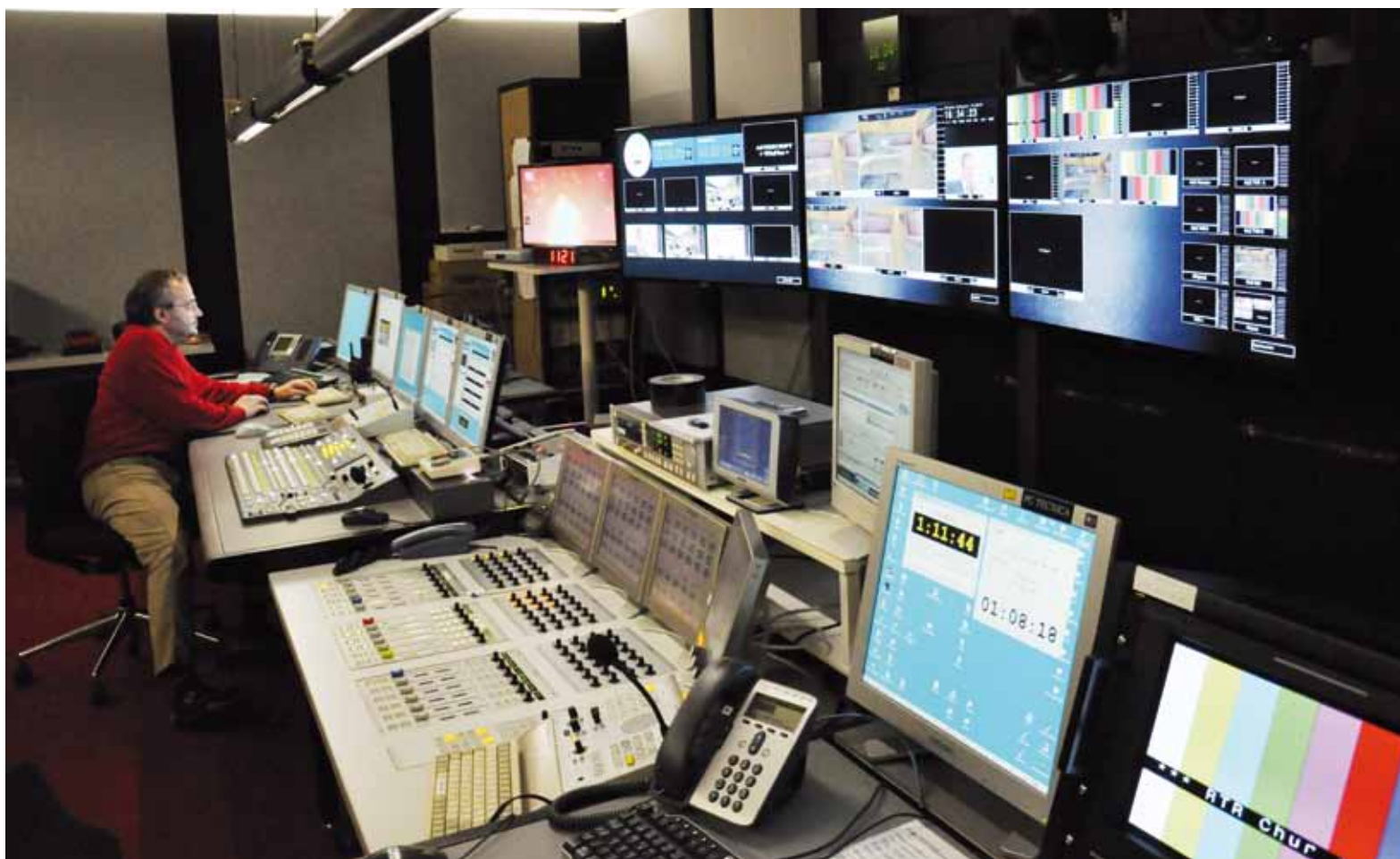
Squad en la reschia da la Televisiun Rumantscha.

Sper il sistem da produziun HD èsi dentant anc da remplazzar autra infrastruttura tecnica tar TR per pudair producir HDTV. Uschia è tut l'infrastruttura necessaria en la reschia ed en il studio da televisiun vegnida midada ora (maschadader da maletg, cameras da studio, euv.). La pli gronda midada visibla è la paraid cun moniturs. Enstagl d'in appa-