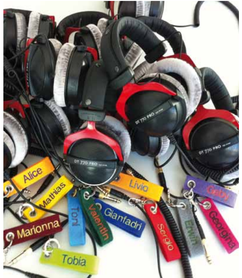
A mintga moderatura ed a mintga moderatur ses uregliers.