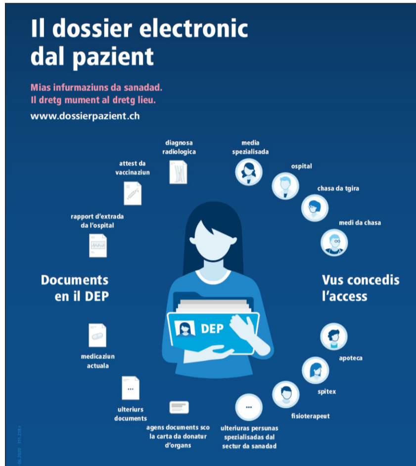
Las infurmaziuns da basa davart il DEP stattan er a disposiziun per rumantsch.

■ Documents d'exempel che Vos pudais arcunar sezza/sez en il DEP: anteriuras diagnosas radiograficas u anteriurs resultats dal labor; diari da las dolurs manà da Vos sezza/sez; valurs da la pressiu dal sang or d'ina app; recept per ils egliers; disposiziun da la pazienta u dal pacient; attest da donaziun d'organs.