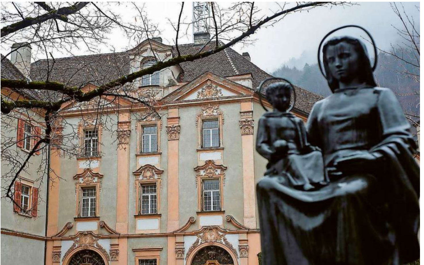
L'investgieu da Cuira ha preschentà in codex da cumportament per evitar abus sexual e spiritual.