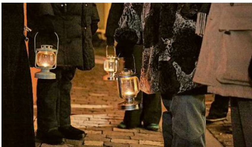
Cun lanternas da gas passain nus tras la citad veglia da Cuira.