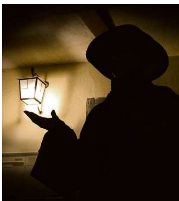
Las istorgias che la guida raquinta fan pel-giaglina.