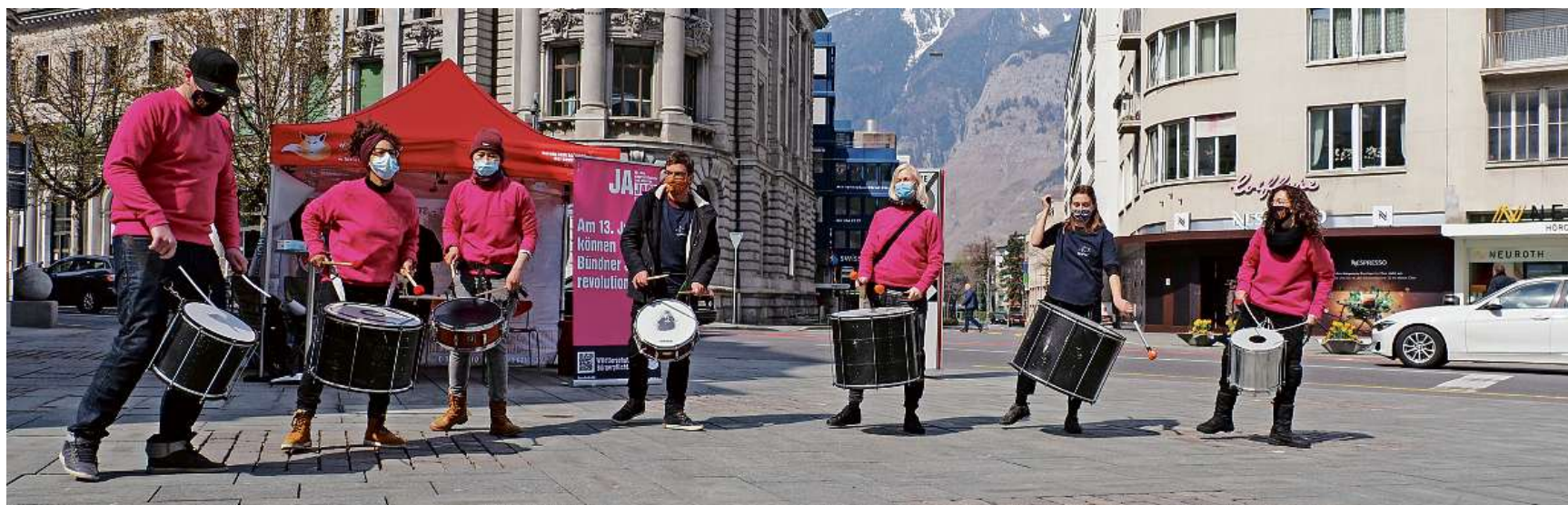
Cun paucas e schumbers da la grupp «Borumbaia» è vegnida lantschada sonda a Cuira la campagna per l'iniziativa da chatscha.