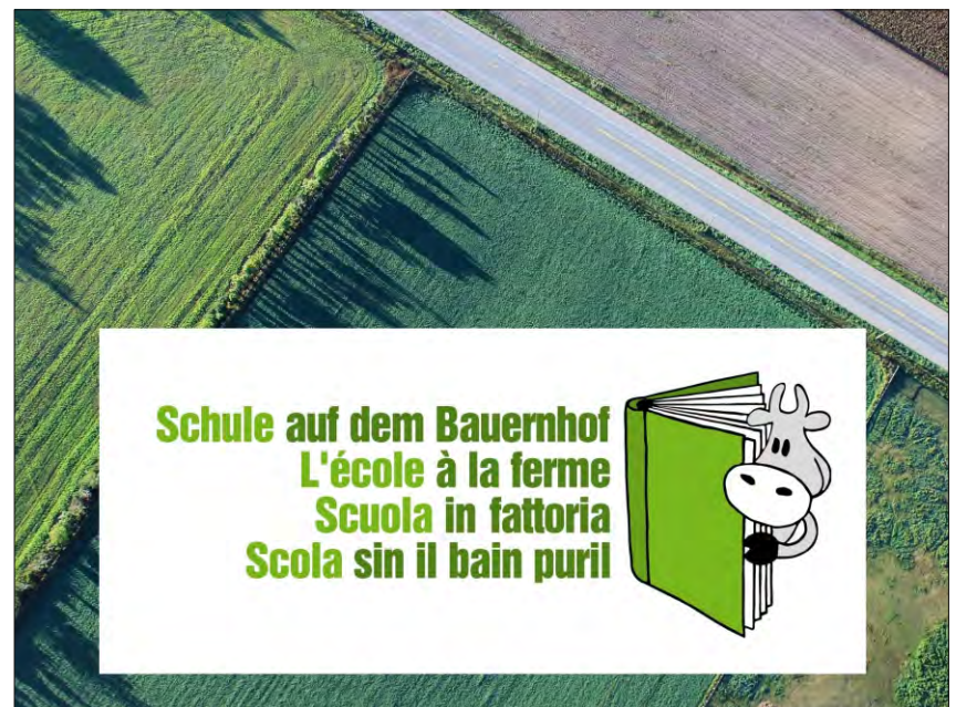
Purchidas per scolas sin il bain puril.

Tge avantatgs han ins, sch'ins cumpra products biologics da la regiun? Plazzas da lavur restan en la regiun. 70 % da la surfatscha cultivada a moda biologica sa chatta en las regiuns da muntogna da la Svizra.