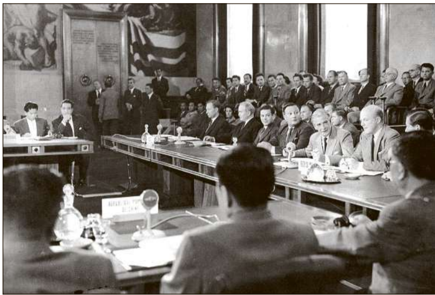
Exempel per ils «buns servetschs» da la Svizra: Conferenza d'Indochina il 1954 a Geneva.

Cuntrari als auters stadis neutrals sco la Svezia e l'Austria è la Svizra sa tegnida fin ils onns 1970 vi dal princip da la retegnientscha en dumondas da la politica ex-