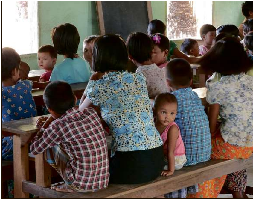
La furmaziun – qua a Myanmar – è ina da las mesiras las pli effizientas per megliar a lunga vista las relaziuns en ils pajais en svilup.

Ils fatgs menziunads mainan ad in circul vizius da miseria. D'interrumper quest circul è la finamira da la collavuraziun da