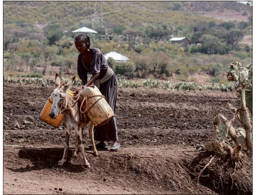
In provediment d'aua adequat – en bleras regiuns anc adina ina chausa che na sa chapescha betg da sazez (foto: Etiopia).

Il Terz Mund sa cumpona dals stadis industrialmain pauc sviluppads en l'Africa, l'Asia e l'America dal Sid. La repartiziun en l'emprim, il segund ed il Terz Mund