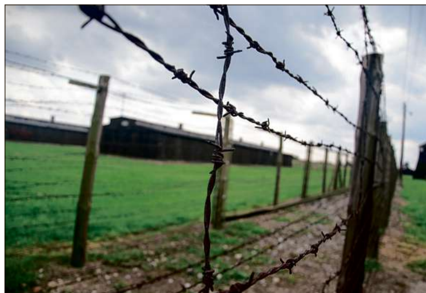
Blers anteriurs champs da concentraziun furman oz lieus da commemoraziun (Majdanek, Pologna).

Dapli infurmaziuns: chatta.ch/?hiid=3177 www.chattà.ch