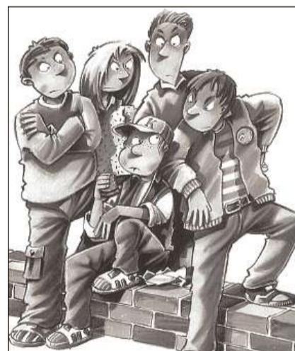
La banda da Hannes emprova da far pressiu – ma senza success.