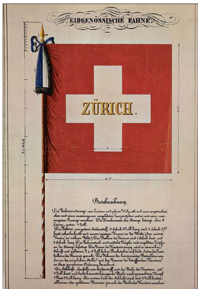
Versiun definitiva da la bandiera militar federala dal 1841.