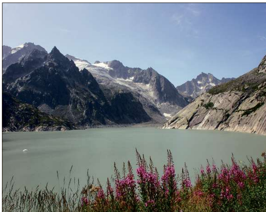
Il Lagh Albina ha furmà il punct da partenza dal Miracul blau.