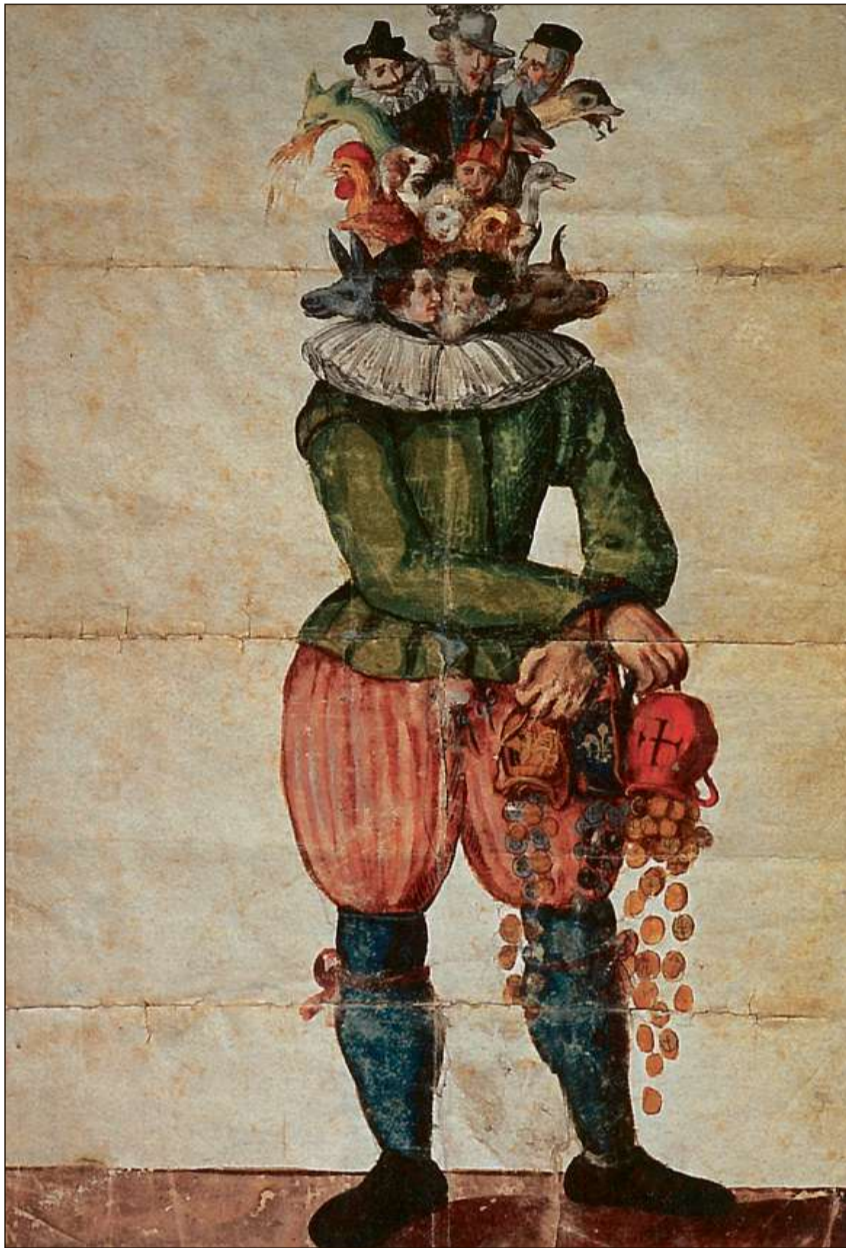
Democrazia corrotta? Represchentaziun satirica da las relaziuns politics en las Trais Lias dal temp dals Scumbigls grischuns.

cumenzà a chapir lur stadi sco republica democratica ed a distanziar quel da las monarchias pir tras il scleriment teoretic da las relaziuns da pussanza a favur da Volck und Gemeinden enturn il 1700.