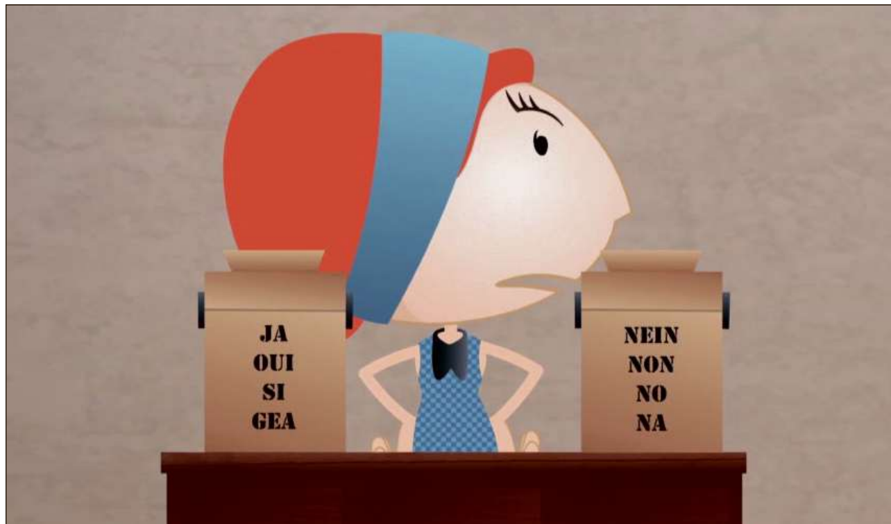
Il dretg da votar da las dunnas – er questa tematica vegn tractada en ina da las numerusas episodas.

Damai ch'ils films animads tractan l'istorgia da la Svizra ed existan en tudestg, franzos, talian e rumantsch, sa porschan els er sco avischinaziun ludica a las autras linguas naziunales. Che quai funcziuna – betg il davos er grazia al stga-