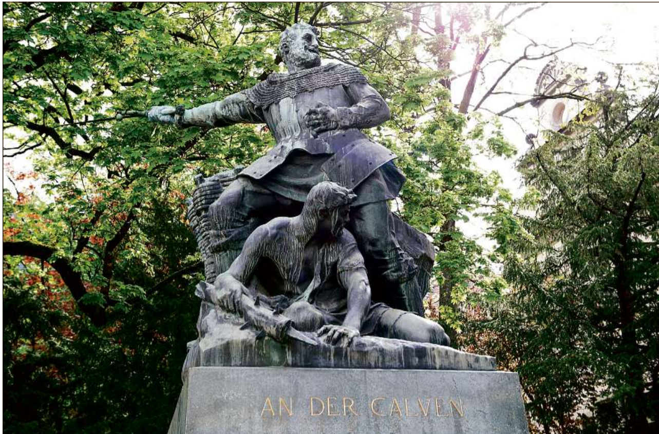
La libertad politica è vegnida considerata sur lung temp sco privilegi acquistà dals perdavants victorius.

Libertad designescha qua il svilup da la libertad politica dal pievel grischun e da sias communitads en general e la libertad persunala, spiertala e religiusa en spezial. Las funtaunas dal temp medieval preschententan dretgs da libertad da caracter politic-statal a partir dals Zaccos/Victorids (8avel tschientaner) fin a las associaziuns dals Libers (14avel tschientaner). A partir dal 8avel tschientaner è era attestada l'existenza da glied libra da persuna. En quest connex ston ins però sa distanziar tant dal stereotip da la libertad gualsra sco dal dualissem simplifitgant feudalissem-democrazia (Liver). La fundaziun da las Lias en il 14avel e 15avel tschientaner, la conclusiun da cunvegns d'agid vicendaivel, campagnas militaras cuminaivlas enturn il 1500 e la conquista da las Terras subditas (1512) han stgaffi las premissas per la pussanza politica d'in stadi defeudalisà e secular. Il Contract federal dal 1524 ha furnì la basa legala per il transferiment da la suveranità als «Cusseglis e dretgiras». La victoria a la Battaglia a la Chalavaina (1499) ha procurà a las Lias la libertad factica da l'Imperi e las duas guerras da Müsch dal 1525 e 1531 han definì e stabilisà il cunfin meridional da la Republica da las Trais Lias cun il ducadi da Milaun. Ils umanists dal 16avel tschientaner, surtut Simon Lem-