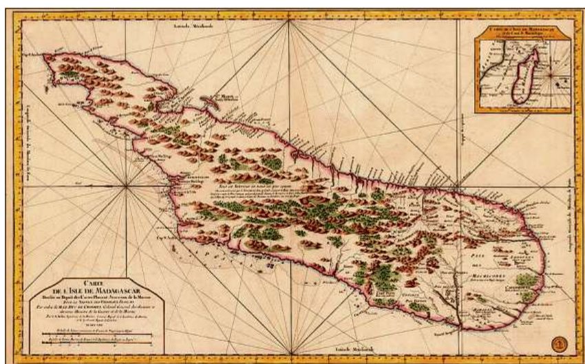
Charta da Madagascar dal 1765 – l'onn che Casper Collemberg l'ha visità e descrit.