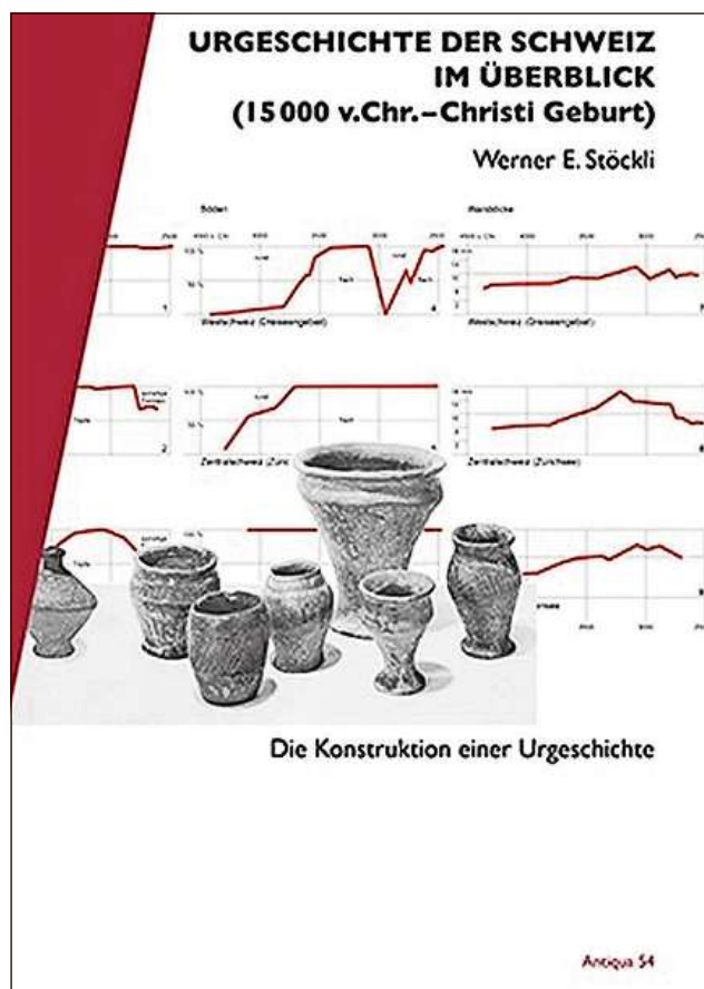
Cuverta da la publicaziun.