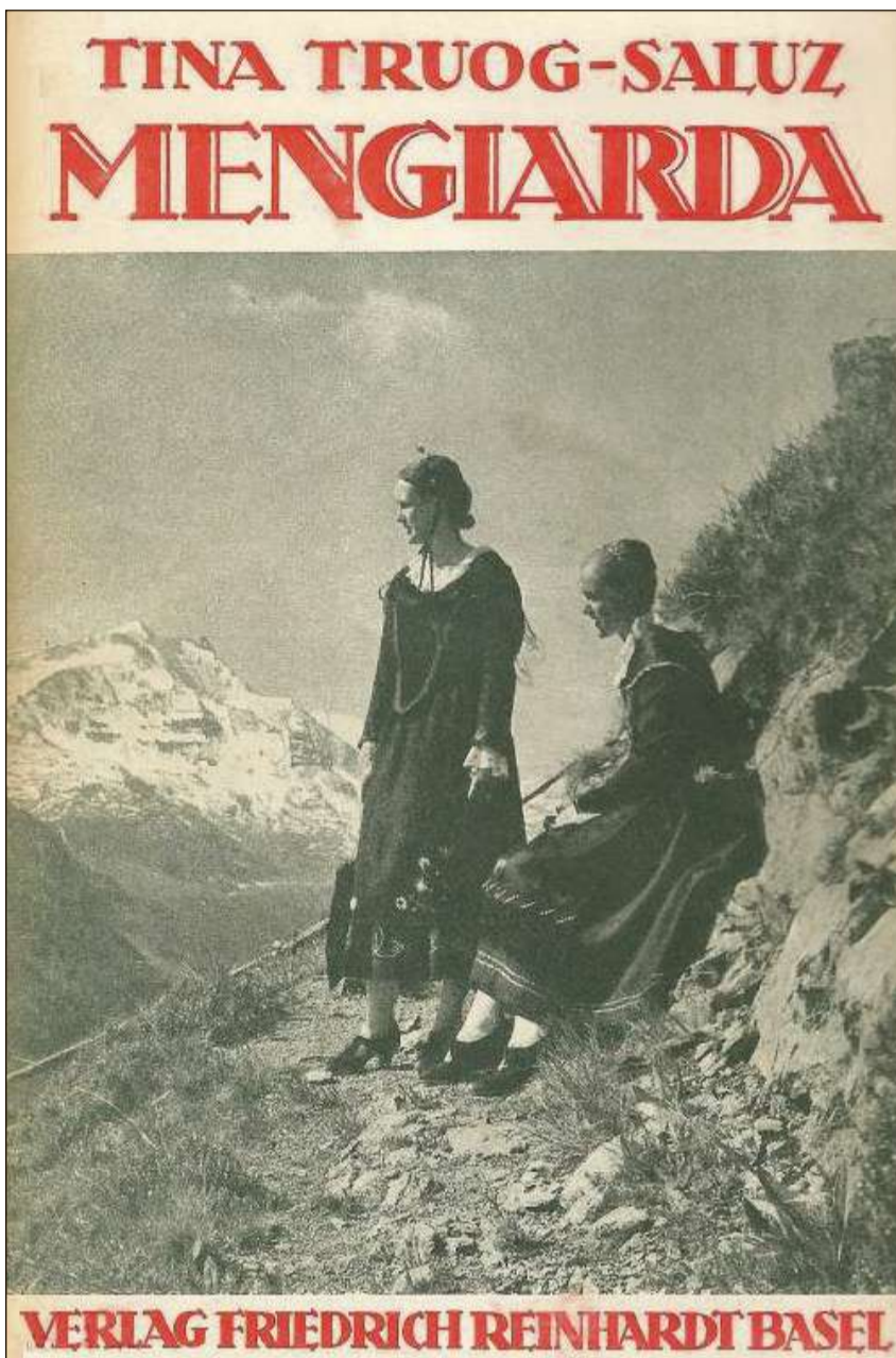
Tina Truog-Saluz (1882–1957) è surtut vegnida enconuschenta cun sia prosa en lingua tudestga.

ta Nudèr. scola media a l'Institut Schmidt a Son Gagl ed a la scola chantunala a Cuira, alura studi d'inschigner da construcziun a la scola politecnica federala a Turitg (1908–13 e 1918–19). Rauch ha lavurà sco geometer, inschigner, redactor e president communal da Scuol ed è stad activ en occupaziun accessorica sco poet, raquintader, cabarettist e trubadur. El ha fundà ed è stà redactor da la «Gazetta Ladina» (1922–39) e dal «Fögl Ladin» 1945–58 (fin il 1945 ensemen cun Robert Ganzoni). Rauch ha scrit raquints da