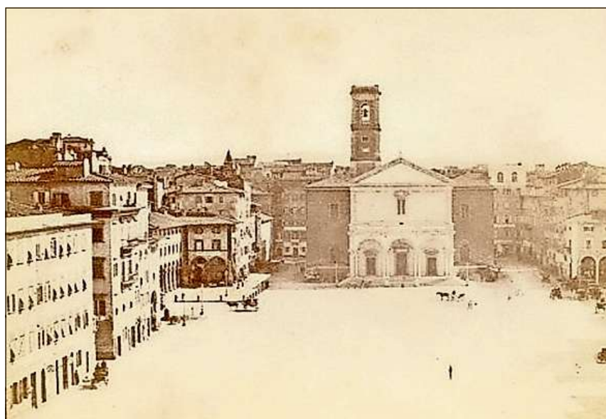
Livorno (vers il 1860) – ina da las numerusas staziuns dals Randulins en l'Italia.

Il LIR cumpiglia bundant 3100 artigels (geografics, tematics, artigels da familias e biografias) davart l'istorgia grischuna/retica e la Rumantschia. Editura: Fundaziun Lexicon Istoric Svizzer; versiun online: www.e-lir.ch ; versiun stampada: www.casanova.ch u en mintga libreria.