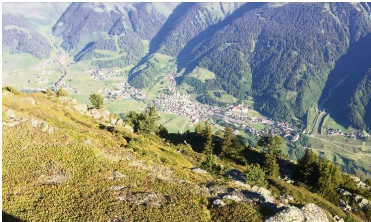
Il reservat da gaud Soliva è sur la vischnanca da Mustér siador.