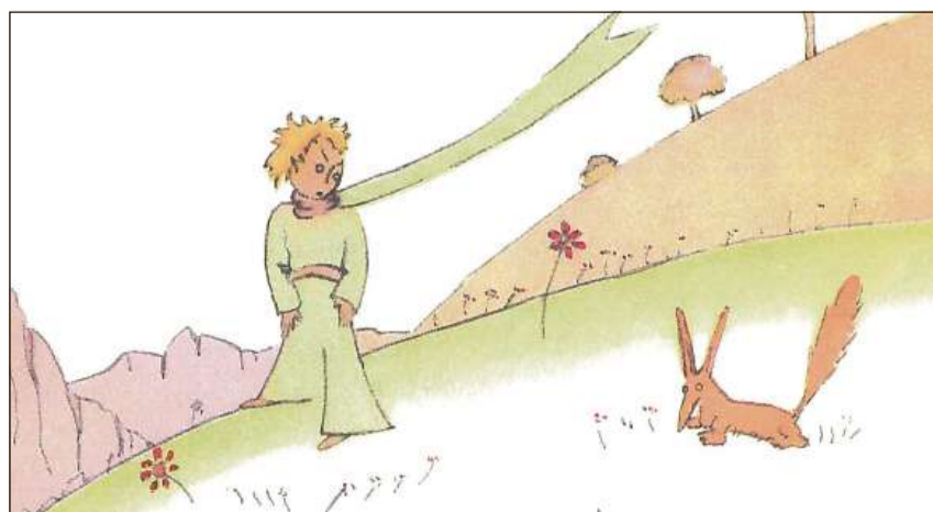
La vulp tradescha al Pitschen Prinzi ses misteri: «Ins vesa bain mo cun il cor. L'essenzial na ves'ins betg cun ils eglis.»

chatta.ch/?id=1338&hiid=241 www.chatta.ch