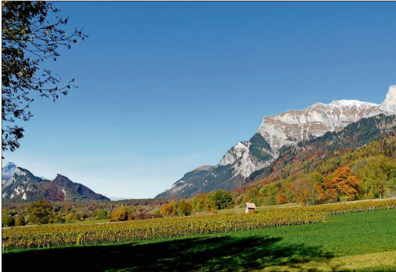
En il Signuradi s'extenda il pli impurtant territori da viticultura dal Grischun.

Fin viaden il 17avel tschientaner vegniva cultivada en il Grischun surtut l'iva alva, per exempel l'Elbling u il Vuclina alv. La vit la pli veglia anc adina existenta, numnadamain quella da Malans, furnescha il Completer che vala sco rarità. Suenter la Guerra da trent'onns (1618–48) è sa derasada l'iva blava da la Bur-