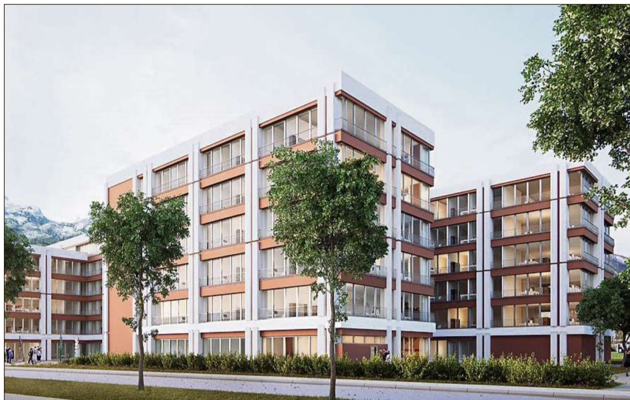
Visualisaziun dal nov center administrativ chantunal «Sinergia».

L'Uffizi da militar e da protecziun civila s'occupa da tut las dumondas areguard il militar (recrutaziun, recruta e curs da repetiziun, taxa d'exemziun dal servetsch militar, servetsch da cumpensaziun e.a.) e da la protecziun civila (ser-