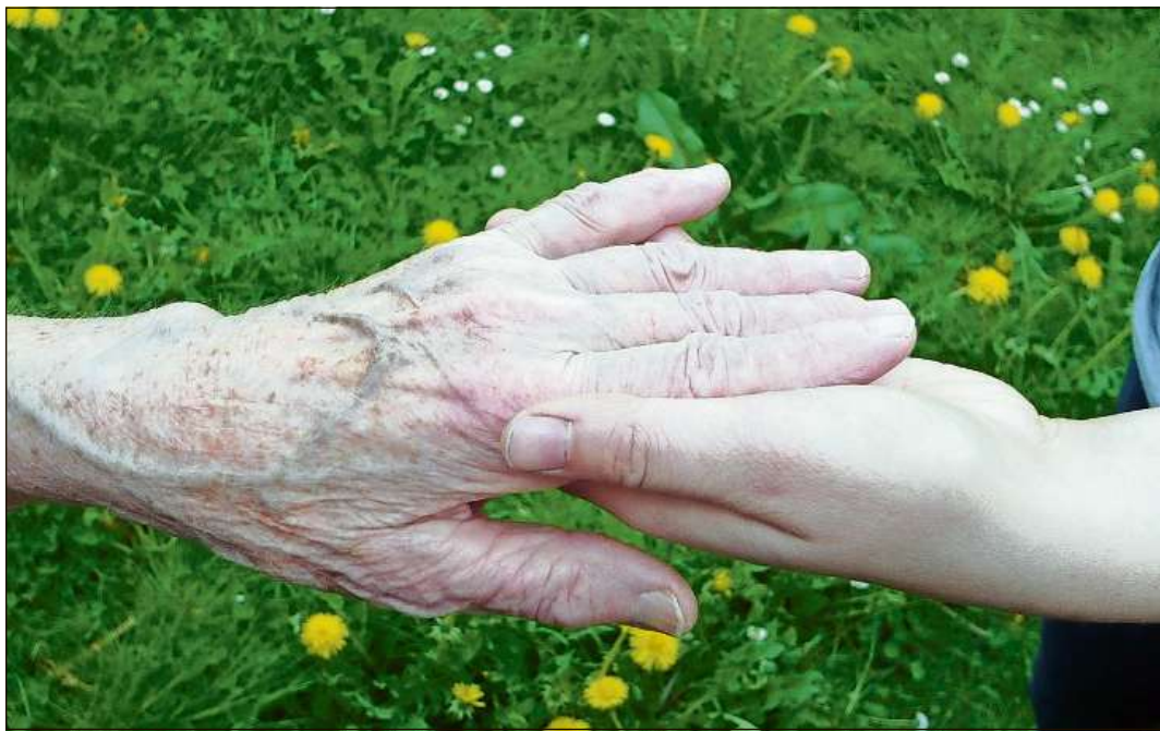
L'inveteraziun – in fenomen che vegn anc ad occupar las generaziuns futuras.

■ En il decurs dal 20avel tschientaner è la quota da las persunas attempadas creschida, entant che la quota dals giuvenils (sut 20 onns) e da las persunas en la vegliadetgna da gudogn (20 fin 64 onns) è sa sbassada. La furma da la piramida da vegliadetgna è sa midada d'ina «piramida» en in «pign» (2014); là domineschan surtut las annadas 1960 fin 1971 cun bleras naschientschas (cf. la grafica). La generaziun dals giuvenils è plitost flaiyla, entant ch'il dumber d'umans attempads crescha cuntinuadamain. L'inveteraziun vegn a cuntinuar. Igl è da quintar che la quota da las persunas che han 65 onns e dapli crescha fin l'onn 2060 da 17,8% (2014) sin var 28%. L'augment da la populaziun en Svizra è d'attribuir ils ultims onns surtut al surpli d'immigraziuns e mo per ina pitschna part al surpli da naschientschas.