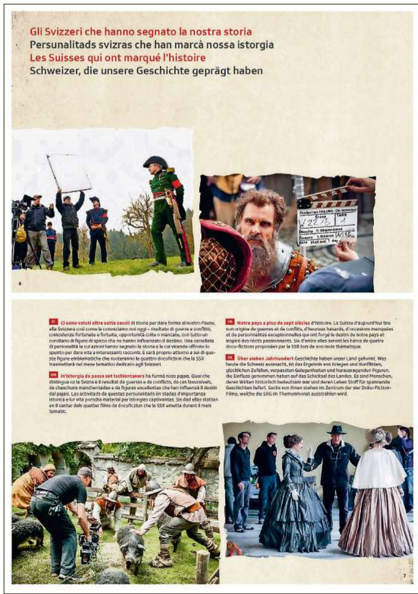
Tar las docuficziuns è cumpari in vast material accumpagnant.