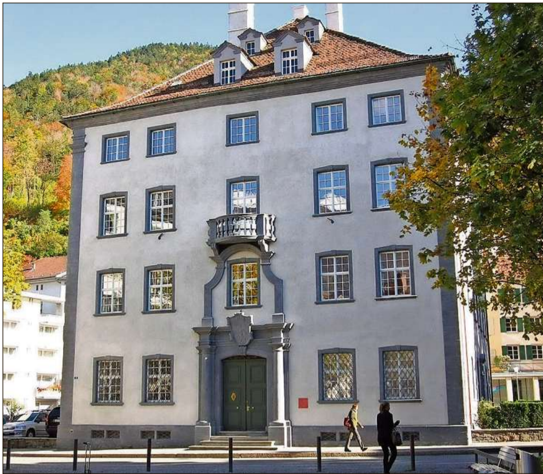
La Chanzlia chantunala sa chatta a Cuira en la «Chasa grischina».

Ultra da quai è la Chanzlia chantunala il post da contact per ils servetschs centralas da la Confederaziun e dals chantuns sco er da las regiuns estras vischinas e procura che las relaziuns externas vegnian tgradas ed amplifitgadas. En quest connex s'occupa el