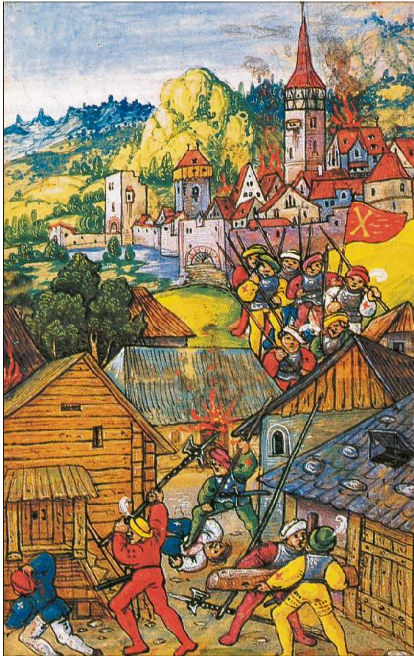
Il favrer 1499 attatgan mercenaris da la Lia svabaisa la citadina da Maiavilla.