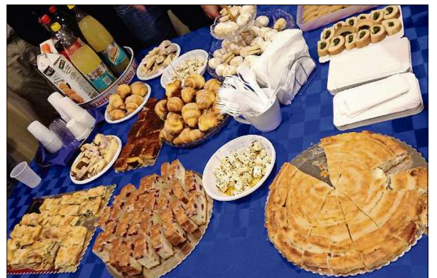
Spezialitads culinarias dals Cincar ch'els han preparà per la «vlach-night».