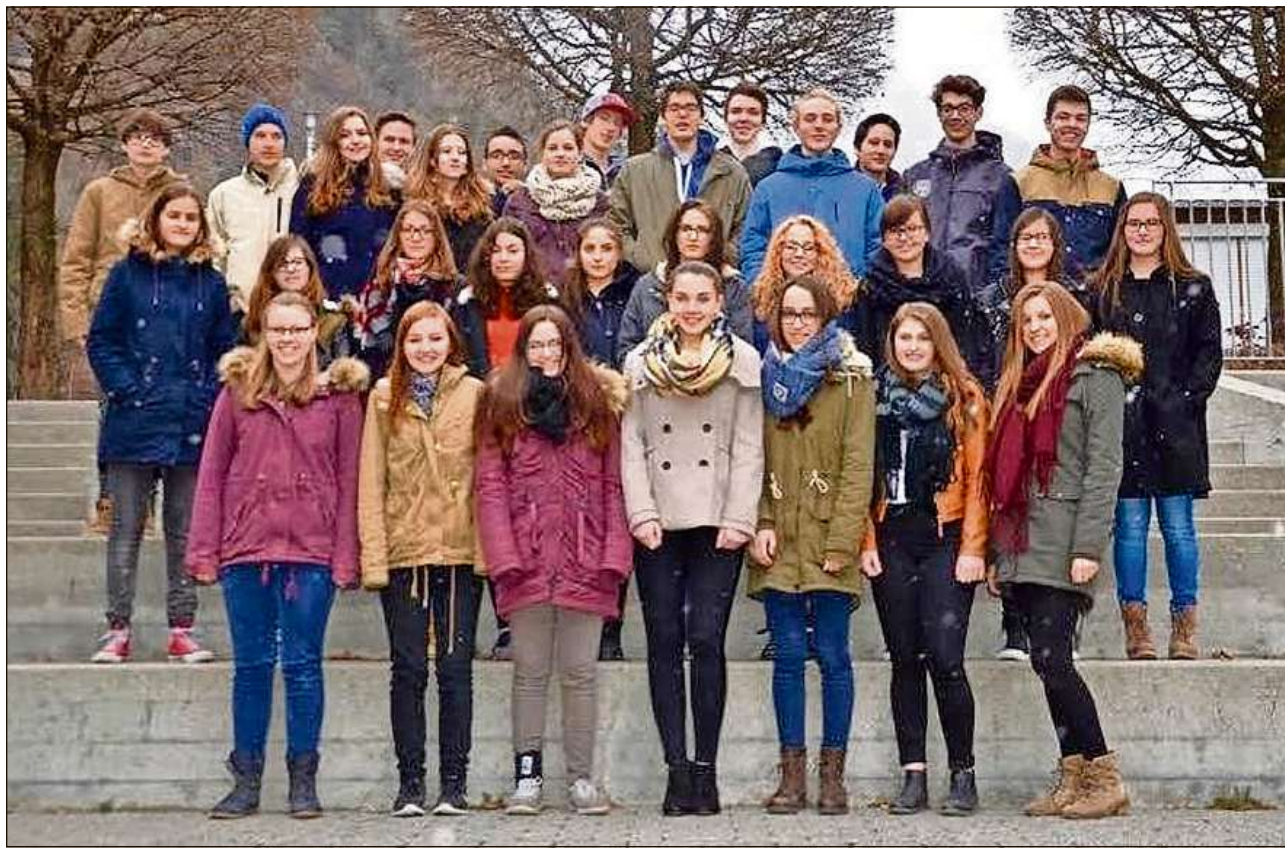
Il Chor Rumantsch da la scola chantunala da Cuira sgola bainprest en ils Stadis Unids da l'America.

Igl Chor Rumantsch ò gia taimps cun pi pac(a)s cantadour(a)s e taimps noua tgi el stava prest alla limita dalla sia existenza e taimps cun bler(a)s cantadour(a)s. Nous ischans fitg loschs tgi igl mument totgan 40 cantadour(a)s agl noss chor. I fò grond plascheir dad aver tants tgi èn motivos ed angaschas per cantar, pigl chor e per la cuminanza. Scu mintg'onn dainsa er chest onn en concert. Ma chest'onn dattigl dus concerts fitg extraordinaris, damai tgi nous luvragn cun