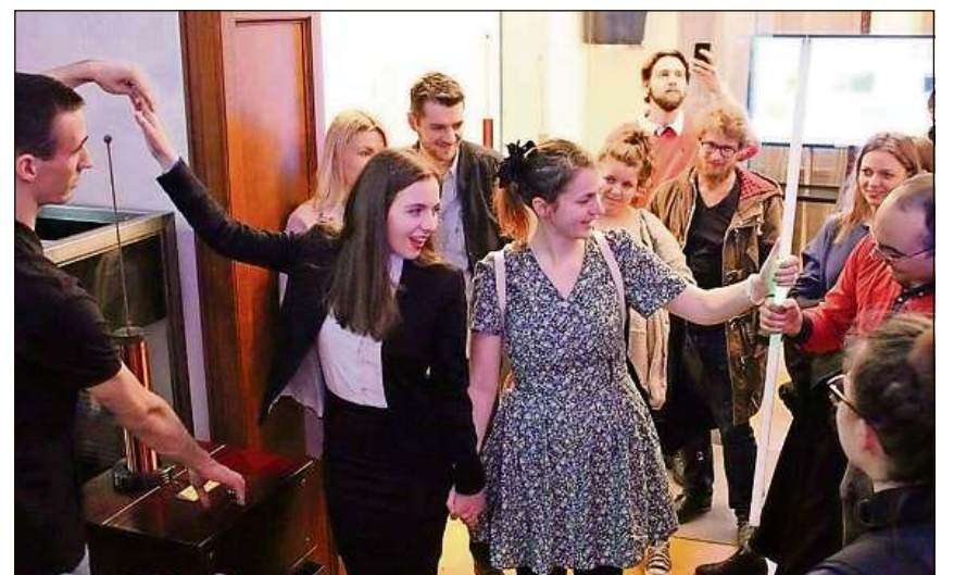
Participantas e participants fotografà a l'avertura uffiziala dal seminari da minoritads a Belgrad (Youth of European Nationalities).

entà ina gronda ospitalitad davart dals Cincar sco er in vair interess davart tut las minoritads envers nossa atgna cultura. Igl è stà in seminari intensiv e fitg enritgint che ha ina giada dapli demonstrà che il fatg dad esser ina minoritad collia – independent da fatgs sco derivanza, bainstanza, lingua, religiun u cultura. Uschia restà be da dir «hvala» – grazia fitg e speranza fin in'otra giada insanuar ina da questas sentupadas nunembli-davlas tranter minoritads.