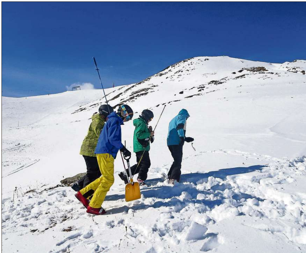
Divers scolars sin in post per tschertgar insatgi sut la neiv.

Tar la proxima fermada ha noss manader declerà a nus il bulletin da lavinas. Uss enconuschain nus ils differents privels. Nus enconuschevan teoreticamain tut quels privels avant, ma enfin ussa n'avain nus anc betg propi fatg quità sur da quai. Davent dad us-