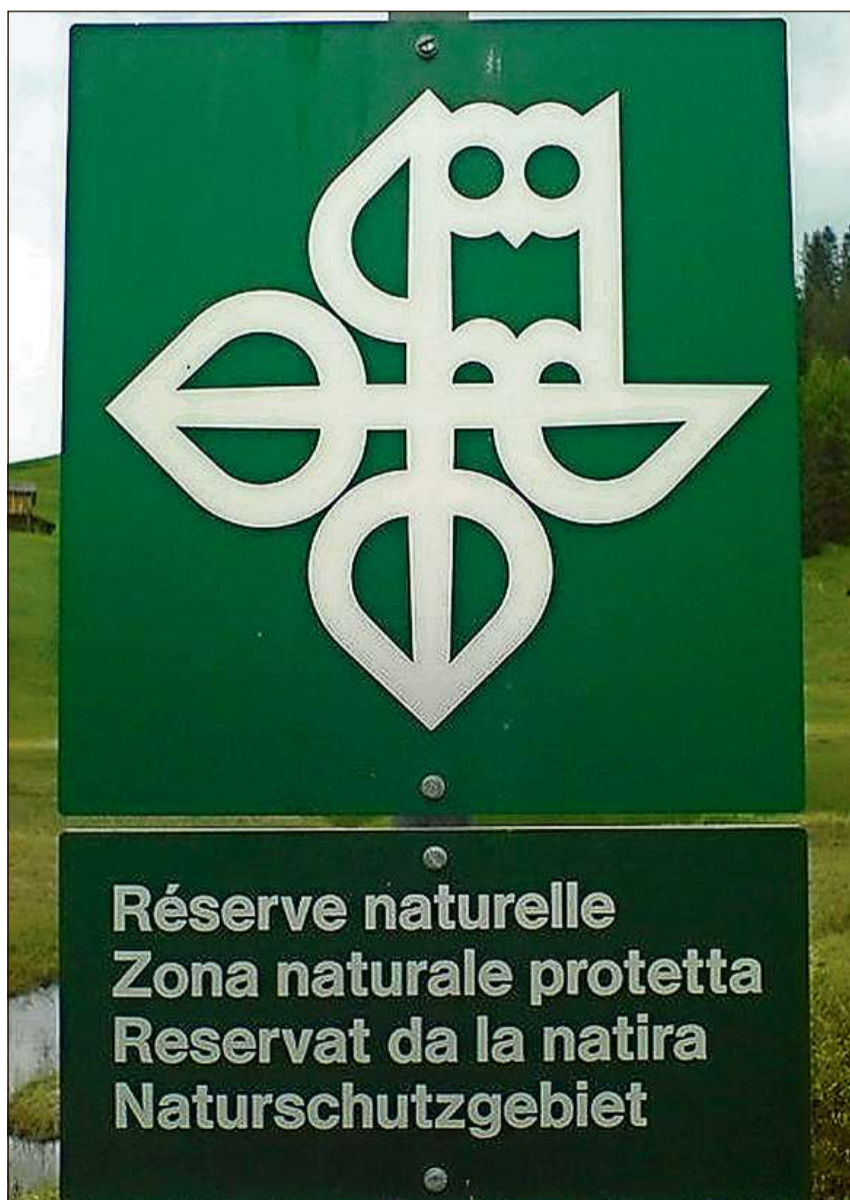
Tavla en quatter linguas dal territori protegì sper il Lai da Stels, Aschera

Dapli infurmaziuns: chatta.ch/?hiid=3650 www.chattà.ch