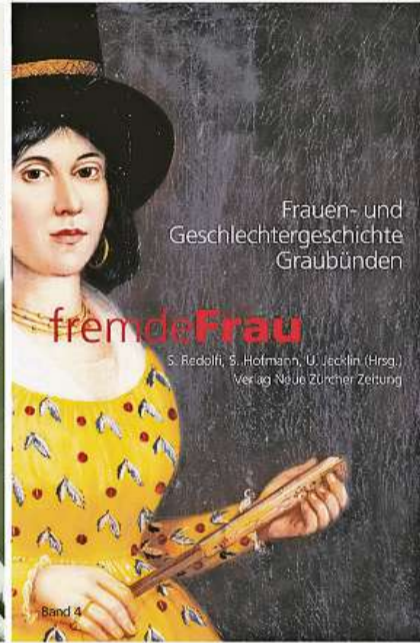
Cuvertas dals quatter toms da «Fraubünden».

gnuna, commerzianta, mamma e consorta nudà ils eveniments a Grevasalvas sur il Lai da Segl, nua ch'ella ha passentà las stads ensem cun autras puras da muntogna, lur uffants ed ils pasters pitschens. Ils umens pendulavan vi e nà tranter l'alp da la famiglia ed il vitg da Soglio ch'era in marsch d'indavent da l'alp. L'autura ha scrit tant davart la vita d'alp sco era davart eveniments mundials.