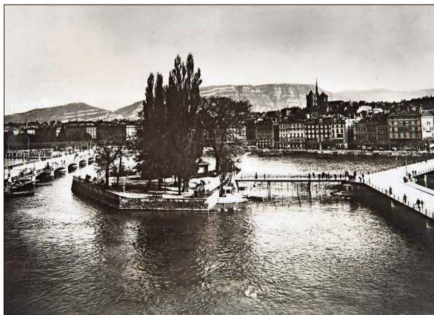
Île Rousseau a Genevra vers il 1900.

Dapli infurmaziuns: chatta.ch/?hiid=3702 www.chatta.ch