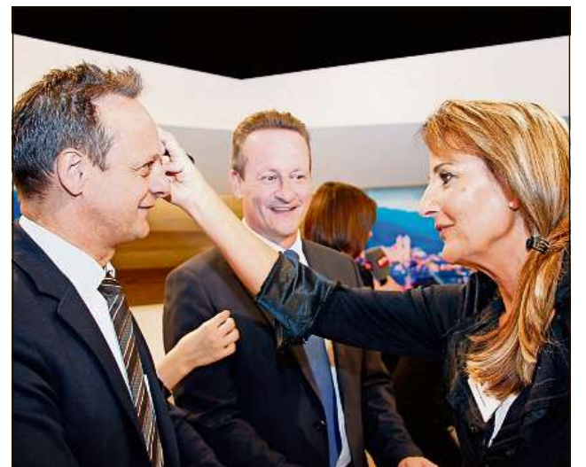
Avant ir tar la televisiun vegn da si il belet.