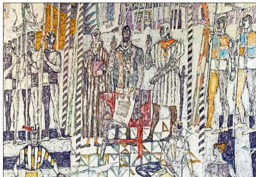
Pictura murala dad Alois Carigiet en la sala dal Cussegl grond a Cuira.